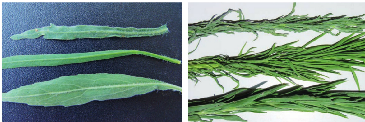
Foto 3. Detalle de las hojas. De arriba a abajo: C. bonariensis , C. canadensis y C. sumatrensis .