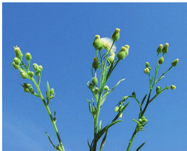
Foto 2. De izquierda a derecha: inflorescencias de C. sumatrensis , C. bonariensis y C. canadensis .

a observarse el margen dentado. Una representación del inicio del desarrollo fenológico de las tres especies de Conyza se muestra en las fotos 4 a 7 .