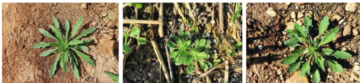
Foto 6. Especies de Conyza en estado de roseta desarrollada. De izquierda a derecha: C. bonariensis , C. canadensis y C. sumatrensis .