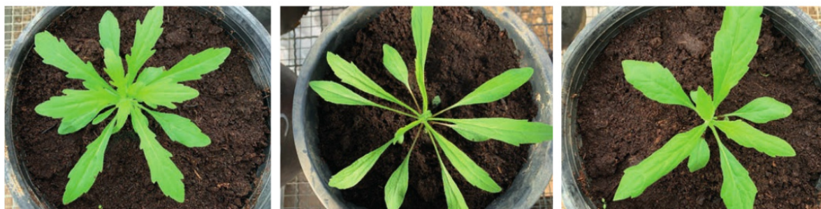
Foto 7. Especies de Conyza en estado de roseta adulta. De izquierda a derecha: C. bonariensis , C. canadensis y C. sumatrensis .