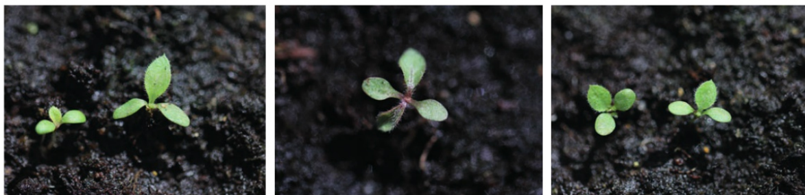
Foto 4. Especies de Conyza en estado de cotiledones y primera hoja. De izquierda a derecha: C. bonariensis , C. canadensis y C. sumatrensis .

trar también un ciclo bienal o incluso perenne según las condiciones ambientales. Las tres especies son preferentemente de germinación otoñal e invernada, aunque C. bonariensis muestra también una germinación primaveral (figura 2). Las semillas (cipselas) muestran una escasa dormición y la germinación y emergencia vienen determinadas por la temperatura y humedad del suelo, pero las semillas pueden, de manera ocasional, ser inducidas a una dormición secundaria cuando las condiciones para la