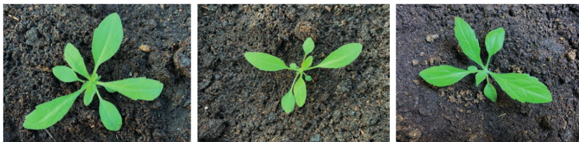
Foto 5. Especies de Conyza en estado de roseta de hasta siete hojas. De izquierda a derecha: C. bonariensis , C. canadensis y C. sumatrensis .