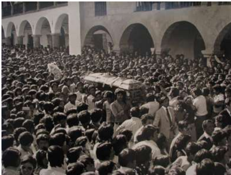
FIGURA 3. Fotografia del multitudinari funeral d'Edith Lagos a Ayacucho.