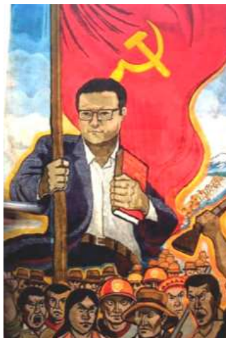
FIGURA 1. Imatge propagandística de Sendero Luminoso.

IMATGE DE LA PORTADA. Cartell de propaganda de Sendero Luminoso.