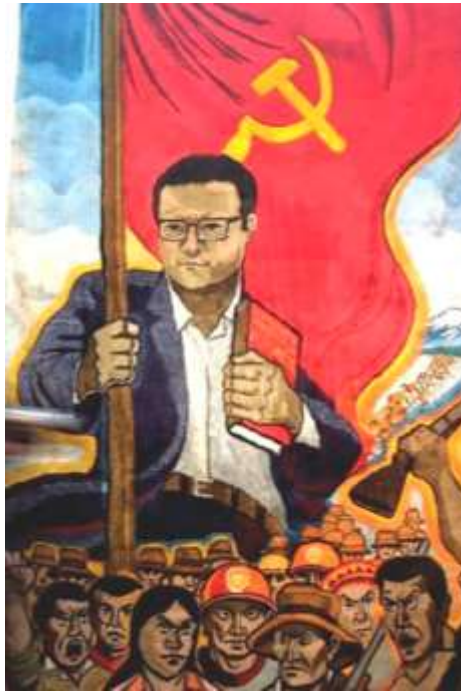
FIGURA 1. Imatge propagandística de Sendero Luminoso. Abimael Guzmán apareix engrandit, amb un llibre en una mà i una bandera roja amb la falç i el martell a l'altra, sent un “professor”, l'ideòleg del Pensament Gonzalo que lidera a les masses.

En aquest context, Abimael ja no voldrà seguir les ensenyances de Mao, voldrà imitar el seu procés històric en el pla ideològic: El seu pensament particular es conformarà com el pensament guia del partit, posteriorment, s'eleva al Pensament Gonzalo , equiparant-se a l'anomenat Pensament de Mao Tse-Tung , finalment, arribarà l'hora de constituir un tipus de “ gonzalisme ”, amb el qual posar-se a la mateixa altura que el marxisme, el leninisme i el maoisme. Conseqüentment, Abimael Guzmán considera que es constituirà com el nou referent internacional del comunisme, una “quarta espasa”, després de Marx, Lenin i Mao. 43