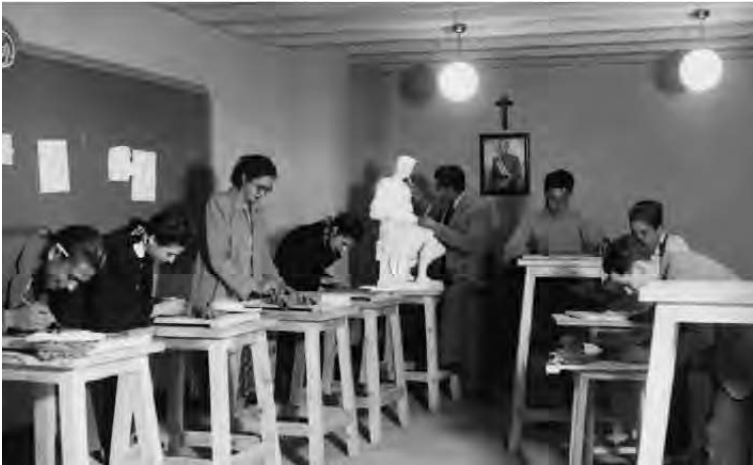
Imatge 1: Classe de modelatge de l'Escola d'Arts i Oficis (c. 1946).

rents disposicions publicades al butlletí oficial de l'Estat permeten refer, ni que sigui parcialment, els detalls del retorn a la normalitat de l'equipament.