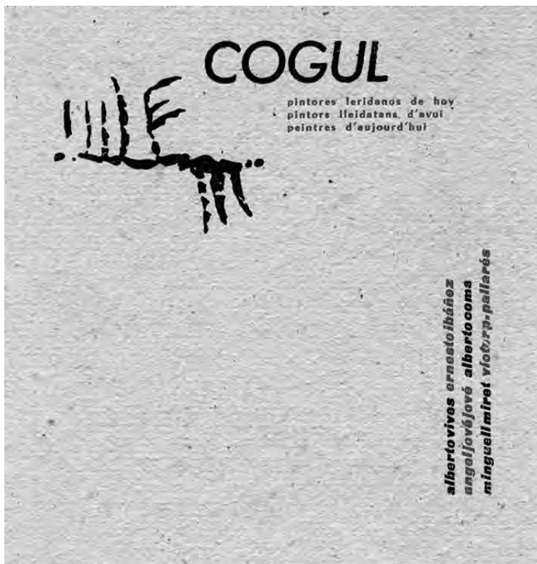
Imatge 7: Portada del fullet de presentació del Grup Cogul (1964).