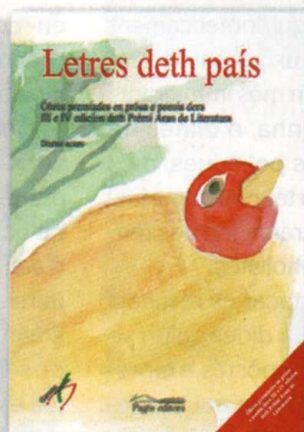
Letres deth país Diuèrsi autors