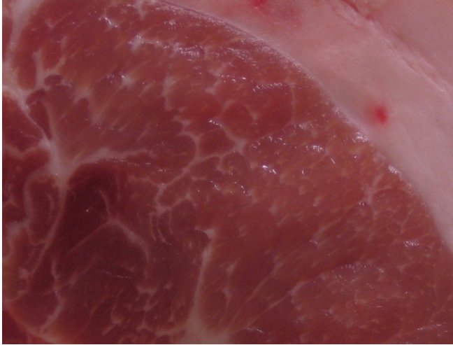
116 117 Figura 1. Lombo com elevado conteúdo de gordura intramuscular. 118 119 120