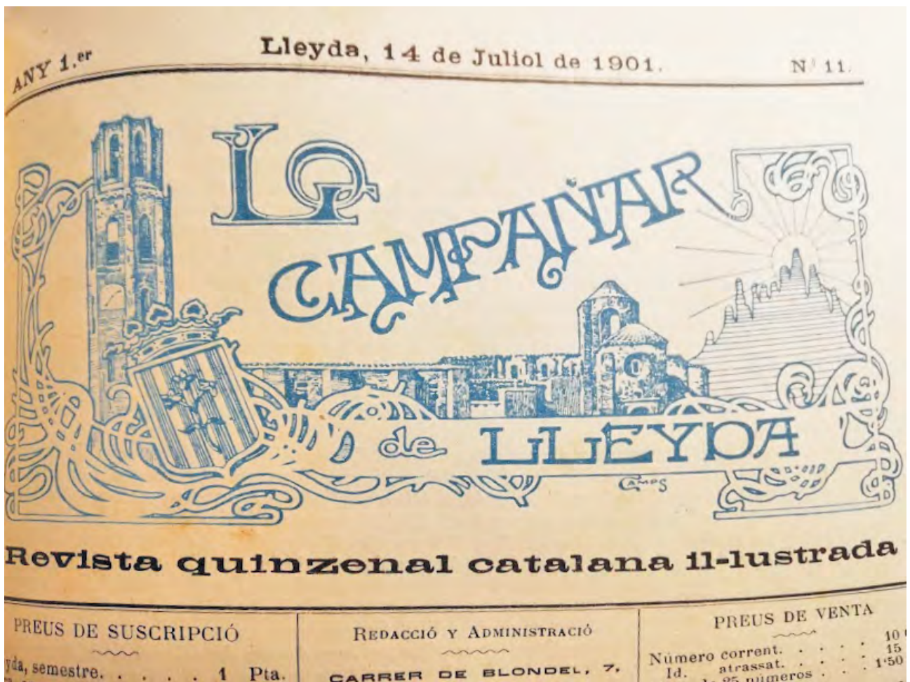
Capçalera de Lo Campanar de Lleyda , on col·laborà.

1917 i vocal del 1917 al 1920. A més, també ocupà diversos càrrecs a la Societat Econòmica d'Amics del País de Lleida i fou soci corresponent de la Reial Acadèmia de Bones Lletres de Barcelona.