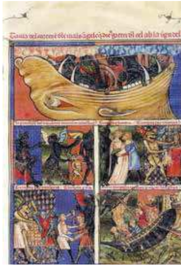
Fig. 5. Detall d'un dels folis del Breviari d'Amor de la Biblioteca Nacional de Rússia, a Sant Petersburg (ms. prov. F. V. XIV.1)