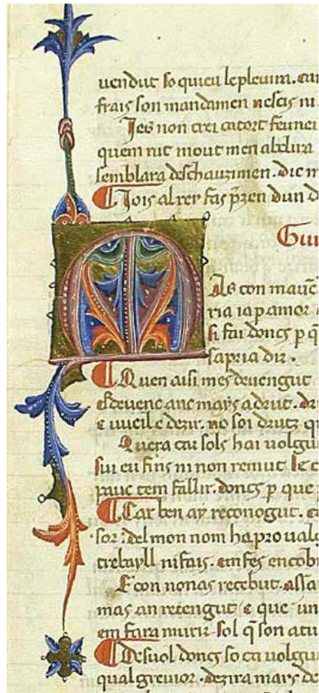
Fig. 4. Caplletres dels folis 49v i 50r del Cançoner SG de la Biblioteca de Cata- lunya.