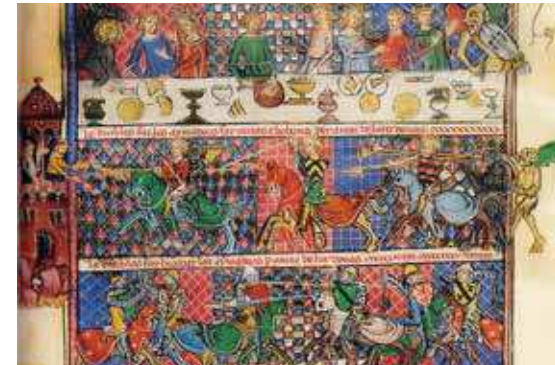
Fig. 6. Un de les il·lustracions a pàgina sencera del Breviari d'Amor de la Biblioteca Nacional de Rússia, a Sant Petersburg (ms. prov. F. V. XIV.1)

Una de les qüestions més interessants avui per nosaltres és la relativa a la identificació d'aquest manuscrit amb el Breviari d'Amor que el comte Pere tenia a Àger el 1372, segons va proposar Cingolani al seu moment —amb reserves—, i fa pocs anys Ferrando —més fermament (CINGOLANI 1990-1991, 61-62; FERRANDO 2007, 20). Segons aquests especialistes, el còdex d'Àger propietat dels comtes d'Urgell podria ser el mateix que l'infant Alfons, futur Alfons el Magnànim, reclamava l'11 d'agost de 1414 a Olf de Próixita 24 , ja que el darrer duia les armes d'Urgell i, a més, era la versió en occità i en vers, com el manuscrit avui servat a Rússia 25 . Això implica su-