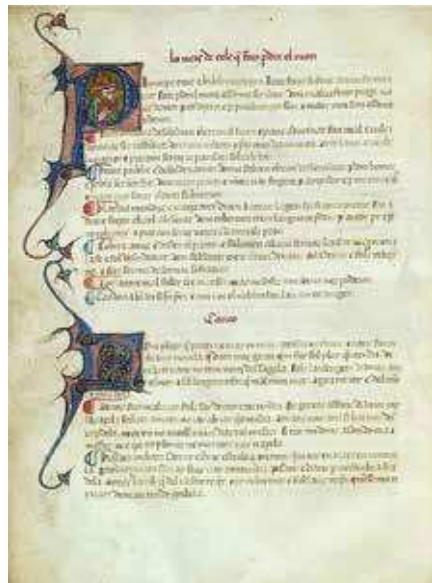
Fig. 3. Detall del foli 2v del Cançoner SG de la Biblioteca de Catalunya.

primer miniaturista és força arcaic, molt afí encara a derivacions del gòtic lineal de filiació bolonyesa, cosa que podria induir a equívocs en la datació del manuscrit, que pels motius apuntats més amunt, cal situar al tercer quart del segle XV.