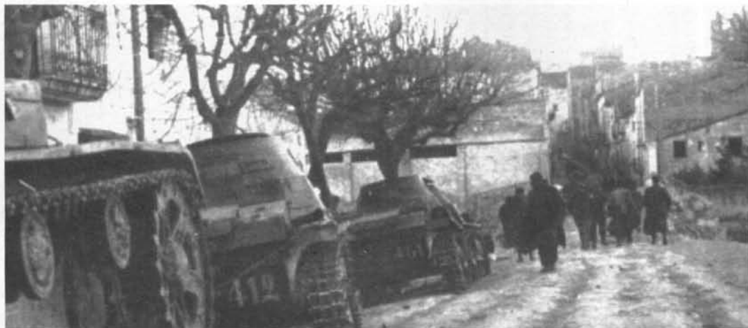
Imatge del poble de Montblanc durant la Guerra Civil. En primera pla, els tancs franquistes aturats a l'entrada del Pont Vell.

ficava. La possibilitat de consultar els sumaris militars, cada cop més accessibles als historiadors, constitueix una font imprescindible per avançar en aquesta direcció. Si més no, aquest és l'objectiu que ens hem proposat tot recreant la història particular de la repressió militar en un sol municipi de la Catalunya rural, on les xarxes familiars i veïnals de col·laboració articulades entorn del franquisme poden ser investigades a mínima escala. Tot plegat, un exercici d'història local que, un cop exorcitzat dels perills del localisme, presentem aquí com un camí per comprendre les dimensions pública i privada del procés repressiu i les arrels socials del fenomen de la violència. La informació obtinguda dels sumaris militars, completada amb d'altres fonts d'informació, especialment amb les fonts orals, ens permet reconstruir les trajectòries particulars de molts dels anònims protagonistes de la histò-