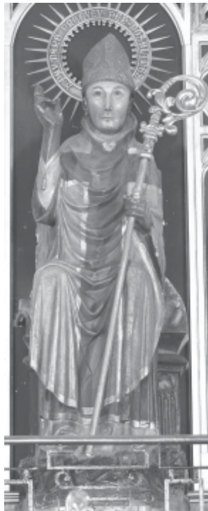
Fig. 5: Sant Pau de Narbona (ca 1320-1330) a l'església parroquial d'Anglesola.