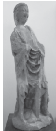
Fig. 7: Verge de la Mora conservada al Museo Calasancio de Calassanç (Osca).