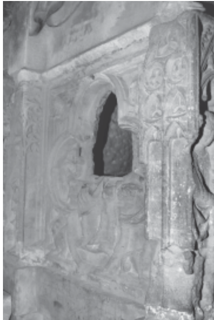
Fig. 3: Vista d'un dels laterals del sepulcre de Ramon Folc VI de Cardona, al monestir de Poblet.

El conjunt pobletà el presideix la imatge jacent del difunt, que va abillat com a cavaller, amb un arnès profusament decorat i un perpunt que presenta l'heràldica dels Cardona, que reapareix en altres parts del sepulcre. Un seguit d'àngels se situen al voltant del jacent, tots ells conservats fragmentàriament. Pel que fa al vas sepulcral, presenta una interessant decoració a la part frontal. Al registre superior trobem un apostolat situat sota arcuacions i claraobies gòtiques, mentre que quatre àngels turiferaris i ceroferaris ocupen els muntants arquitectònics que delimiten els diferents compartiments. Per sota, apareix un segon registre conformat per tres medallons: els dels extrems, amb animals fantàstics i, el central, amb una representació d'un cavaller que sosté un escut amb les armes dels Cardona. Quant als laterals, al dret destaca la presència dels emblemes privatis del finat, mentre que l'esquerre conté un compartiment quadrangular presidit per una forma tetralobulada, dins la qual s'ha ubicat una figura asseguda que es conserva mutilada de cintura per amunt, i que deixa a la vista un important forat (fig. 3). Als angles d'aquest compartiment localitzem els símbols dels evangelistes, la qual cosa indica que la figura central