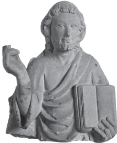
Fig. 1: Maiestas Domini fragmentària procedent d'un dels laterals del sepulcre de Ramon Folc VI de Cardona al monestir de Poblet, avui al Museu de Lleida.

El relleu fou executat amb pedra de les Garrigues i representa un Crist de mig cos, amb la mà dreta alçada en senyal de benedicció, mentre que amb l'esquerra sosté un llibre obert que recolza sobre seu (fig. 1).