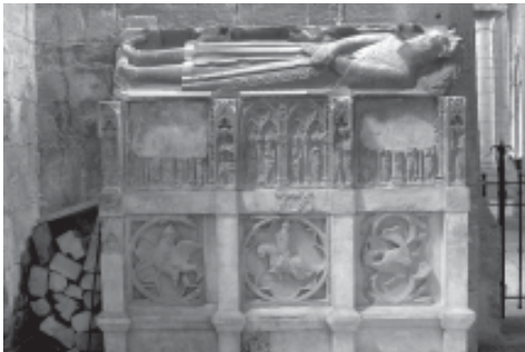
Fig. 2: Sepulcre de Ramon Folc VI de Cardona (ca 1320), monestir de Poblet.

Tornant a la procedència pobletana del relleu, l'hem pogut corroborar de manera conclouent, ja que a Poblet existeix una de les obres atribuïdes sense discussió al Mestre d'Anglesola, el sepulcre de Ramon Folc VI de Cardona, el Prohom Vinculador (1259-1320), vescomte de Cardona i governador de Girona (fig. 2).