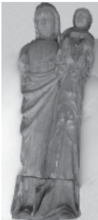
Fig. 6: Imatge de la Mare de Déu amb el Nen (segle XIV), procedent de l'Acadèmia Mariana de Lleida, abans al convent de mercedaris de la ciutat i avui al Museu de Lleida.

Finalment, cal afegir a aquest catàleg de treballs una nova imatge mariana, força desconeguda. Es tracta de la denominada Verge de la Mora, actualment conservada al Museo Calasancio de la vila franjolina de Calassanç (Osca) (fig. 7). 21 Cal deduir que procedeix de l'ermita homònima que s'emplaça a prop de