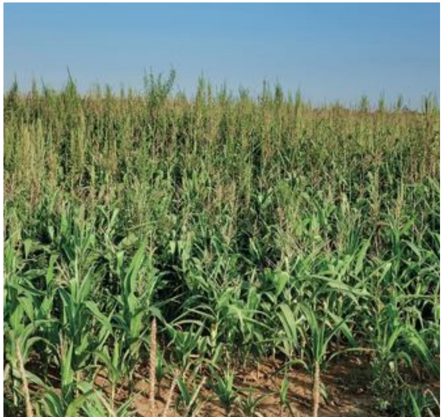
Figura 4. Infestación de Amaranthus palmeri en un campo de maíz cerca de Lleida en 2018.