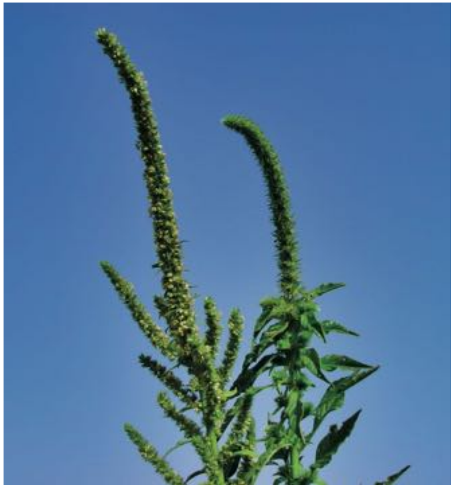
Figura 2. Amaranthus palmeri . Izquierda pie masculino, derecha pie femenino.

Su presencia en España ya había sido registrada con anterioridad por algunos autores. Carretero (1986) identifica como A. palmeri unos ejemplares de herbario recolectados por Sennen en Manlleu (Barcelona) el año 1925, así como un ejemplar observado por él en la zona portuaria de Sevilla el año 1979. Al describir el género en