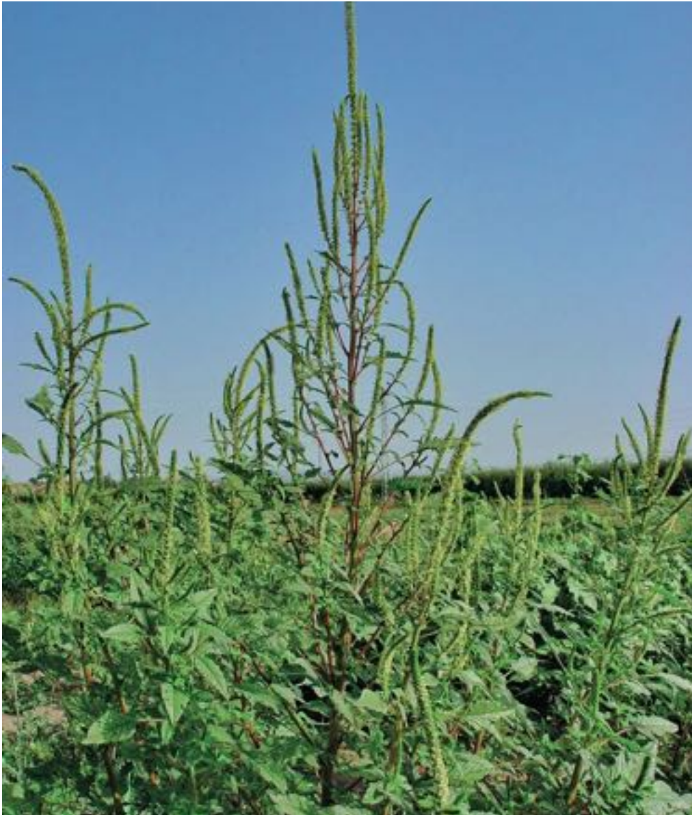
Figura 1. Ejemplar de Amaranthus palmeri .