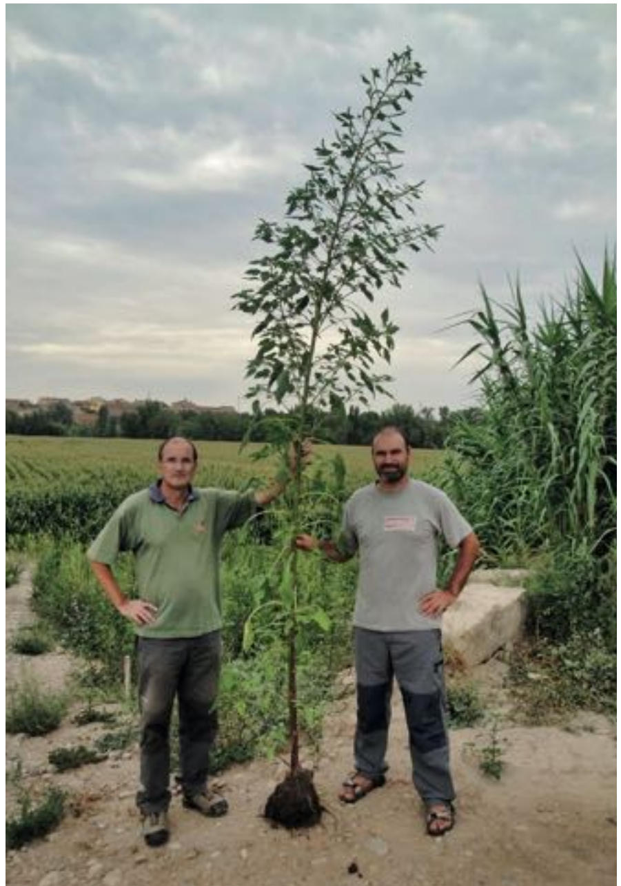
Figura 3. Altura alcanzada por un pie femenino de Amaranthus palmeri .

A raíz de los primeros registros de la presencia de A. palmeri en zonas ruderales y campos de cultivo de Lleida (Recasens y Conesa, 2011; Recasens