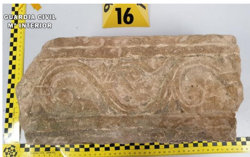
Friso de piedra caliza decomisado en la operación Pandora IV.