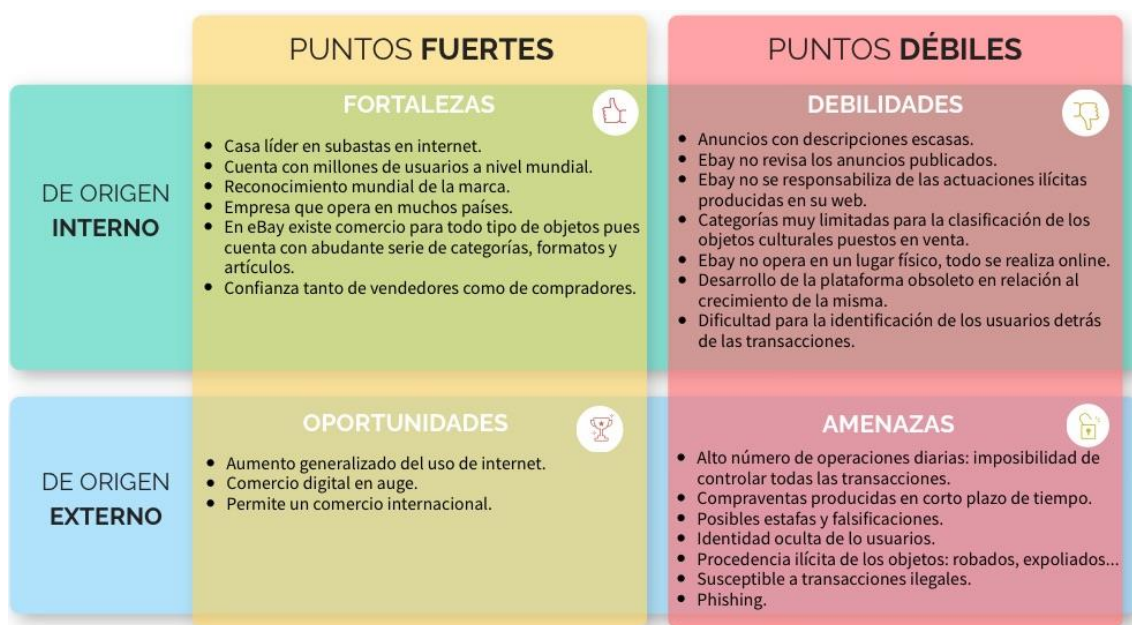
Resumen Dafo.

DAFO es el acrónimo de las palabras: debilidades, amenazas, fortalezas y oportunidades y se trata de una herramienta de estudio que permite analizar la situación de una organización, una institución o de un proyecto. En este caso, se ha procedido a realizar un análisis DAFO de eBay, centrándose fundamentalmente en el análisis de esta web como plataforma para la compraventa de objetos culturales.