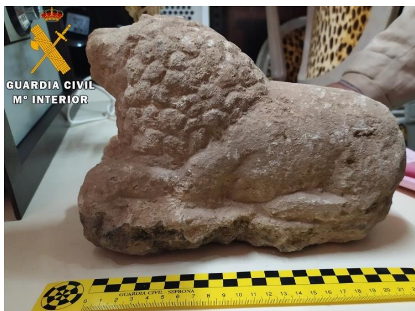
León de piedra caliza decomisado en la operación Pandora IV.