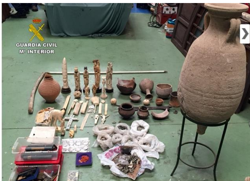
Parte de los objetos decomisados en la operación Pandora II- Athena.