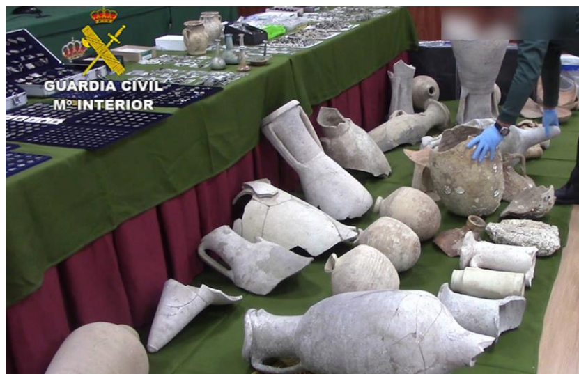
Parte de los objetos decomisados en una investigación de la Guardia Civil en Cádiz.