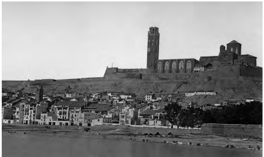
Fotografia panoràmica de Lleida, Charles Clifford (1860). Arxiu fotogràfic històric de la UdL.

La primera fotografia coneguda, fins al moment, de la silueta urbana de Lleida és la que féu Charles Clifford (Gal·les, 1819/1820-Madrid, 1 de gener de 1863) el 6 d'octubre de 1860. El fotògraf gal·lès, com feia habitualment, acompanyava la reina en la visita que féu sa majestat a Lleida per inaugurar la primera estació de ferrocarril de la ciutat. Clifford aprofitava l'estada per prendre fotografies dels indrets per on passaven i les publicava en uns famosos catàlegs que tingueren molt èxit la segona meitat del segle XIX.