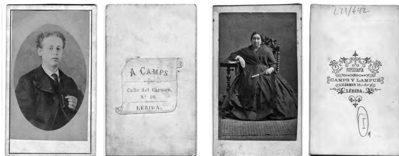
Dues cartes de visita més, la seva especialitat fotogràfica.