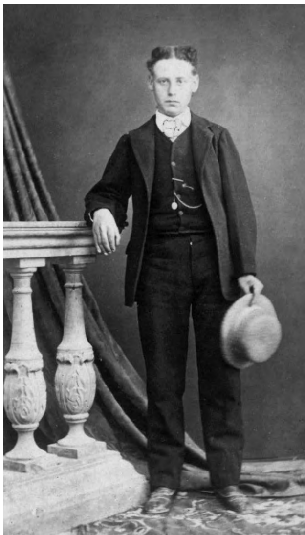
Fotografia d'estudi de 1866. Fotògrafs de Lleida , UdL, 1998, p. 15.