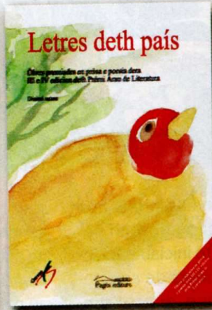
Letres deth país Diuèrsi autors