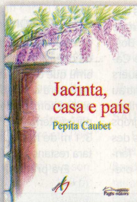
Jacinta, casa e país Pepita Caubet