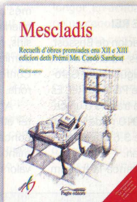
Mescladís Diuèrsi autors