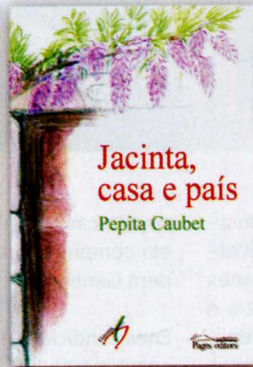
Jacinta, casa e país Pepita Caubet