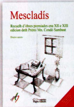
Mescladís Diuèrsi autors