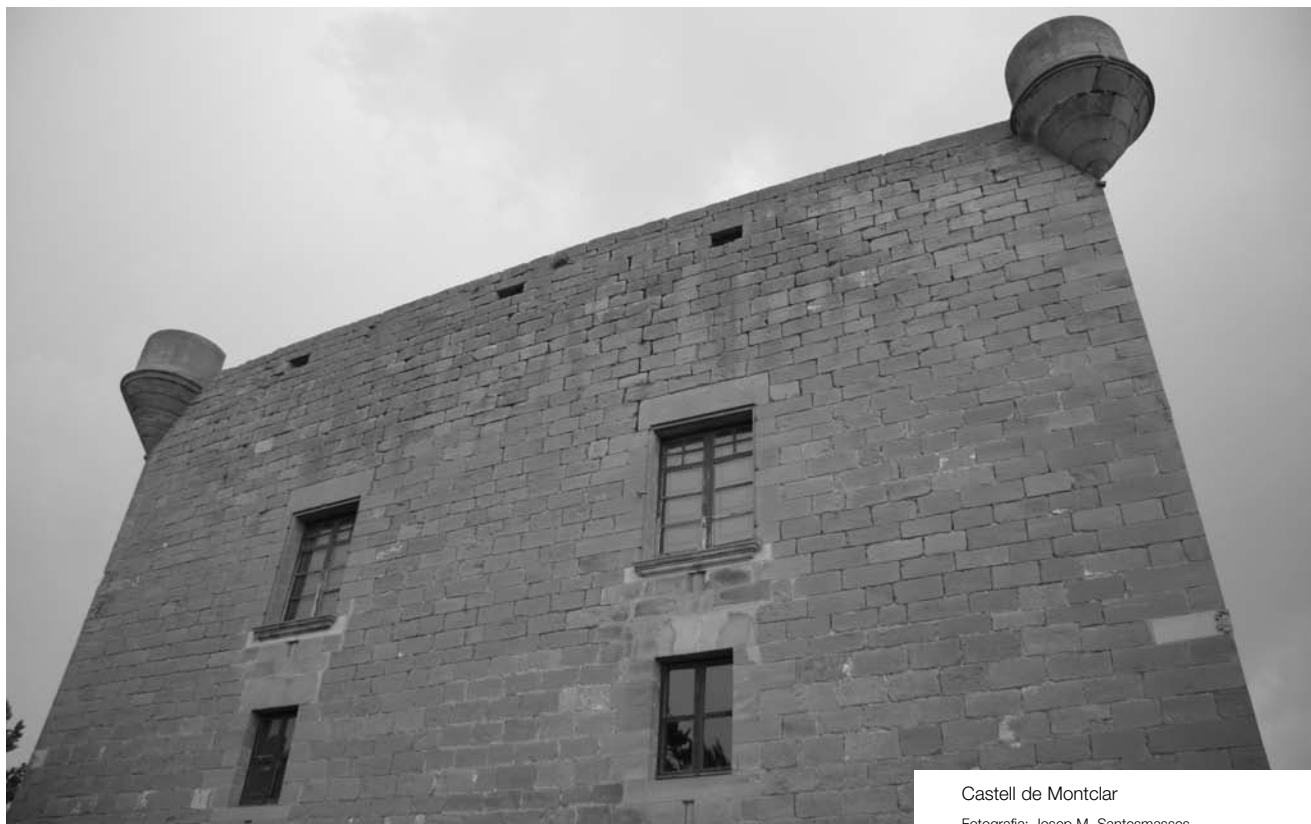
Castell de Montclar