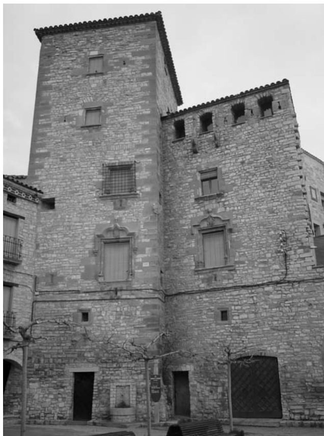
Castell de les Oluges