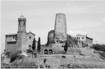
Castell de Lloberola