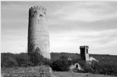
Castell de Vallferosa