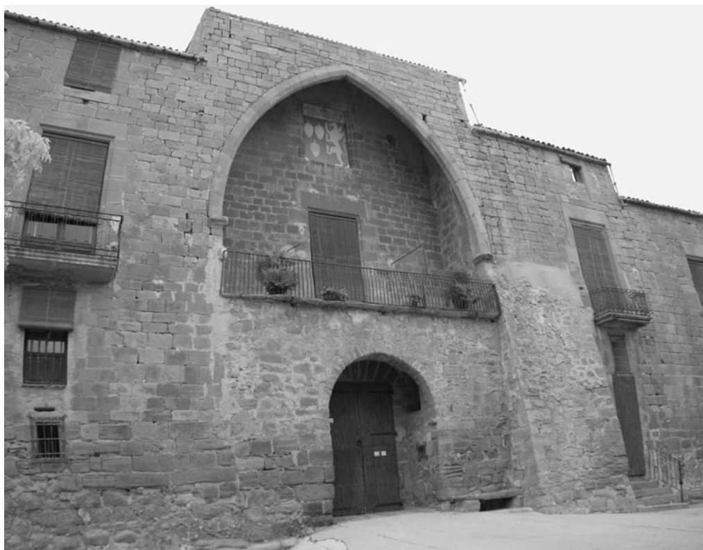
Castell de les Pallargues