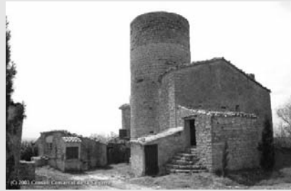
Castell de Mejanell