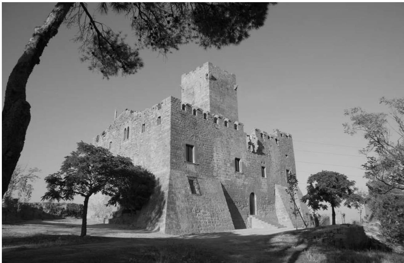
Castell de les Sitges