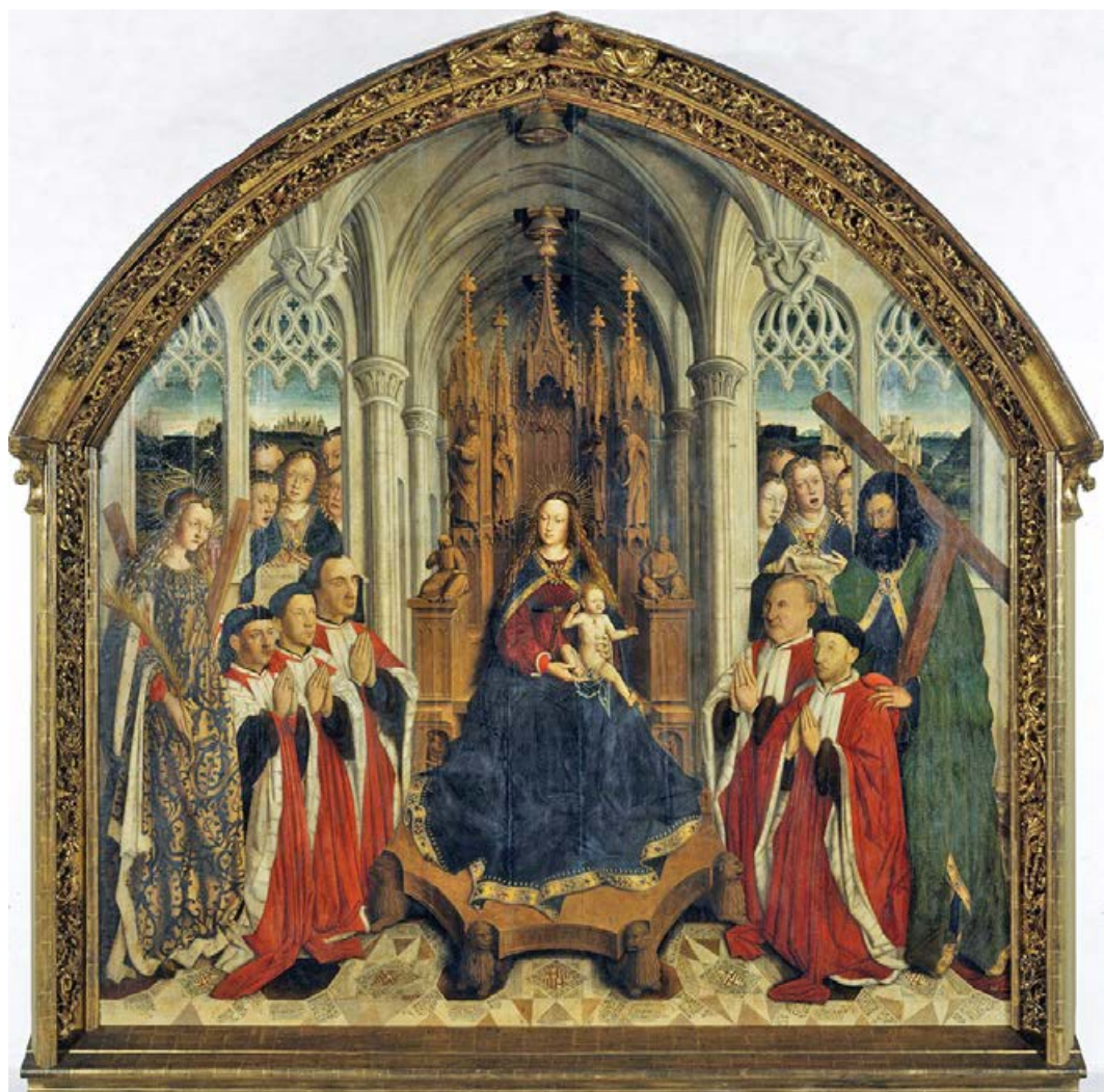
5. Lluís Dalmau, retablo de la Mare de Déu dels Consellers , procedente de la capilla de la Casa de la Ciudad de Barcelona. Museu Nacional d'Art de Catalunya.