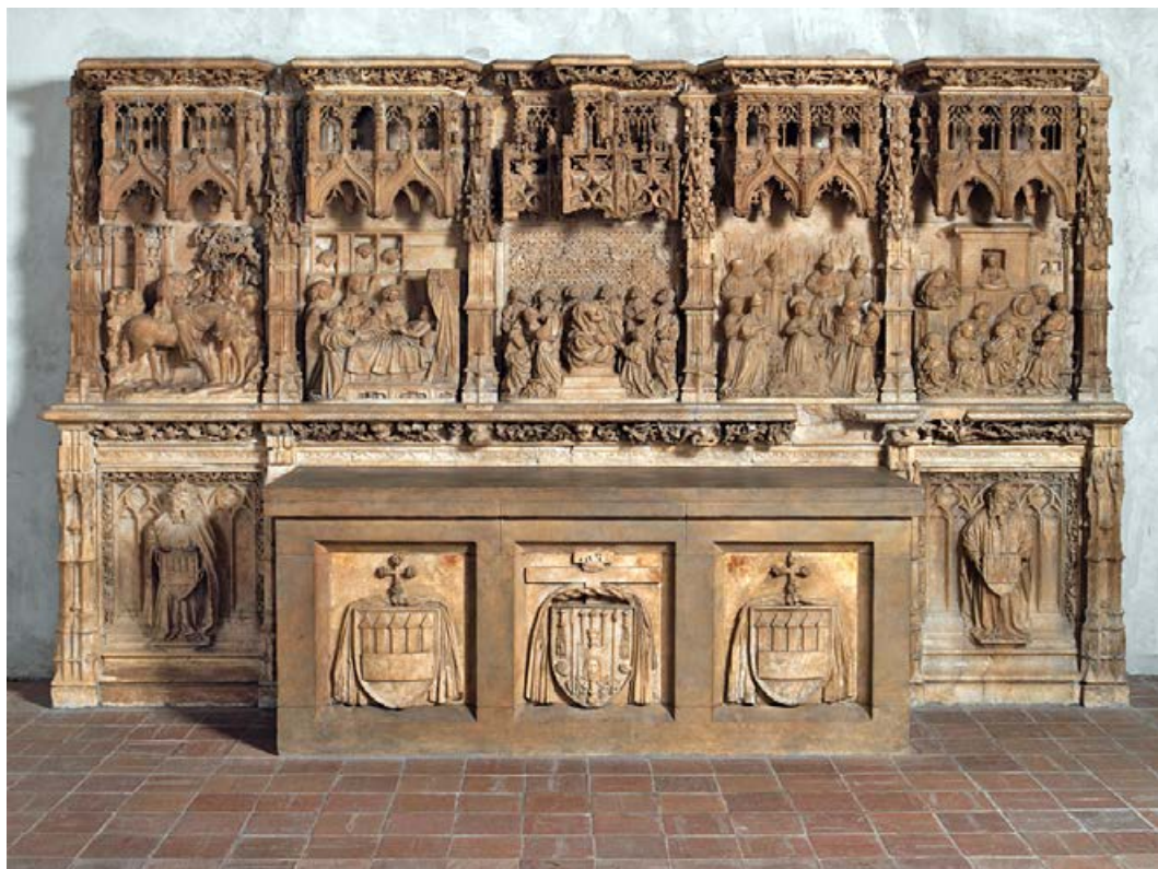
4. Francí Gomar, predela del retablo de la capilla del palacio arzobispal de Zaragoza. Metropolitan Museum of Art (The Cloisters).

otros encargos para el arzobispo en la Seo, como eran el cierre del coro y, también, en el retablo mayor, donde se le documenta obrando desde el 2 de abril de 1457. 49 Al año siguiente el mazonero