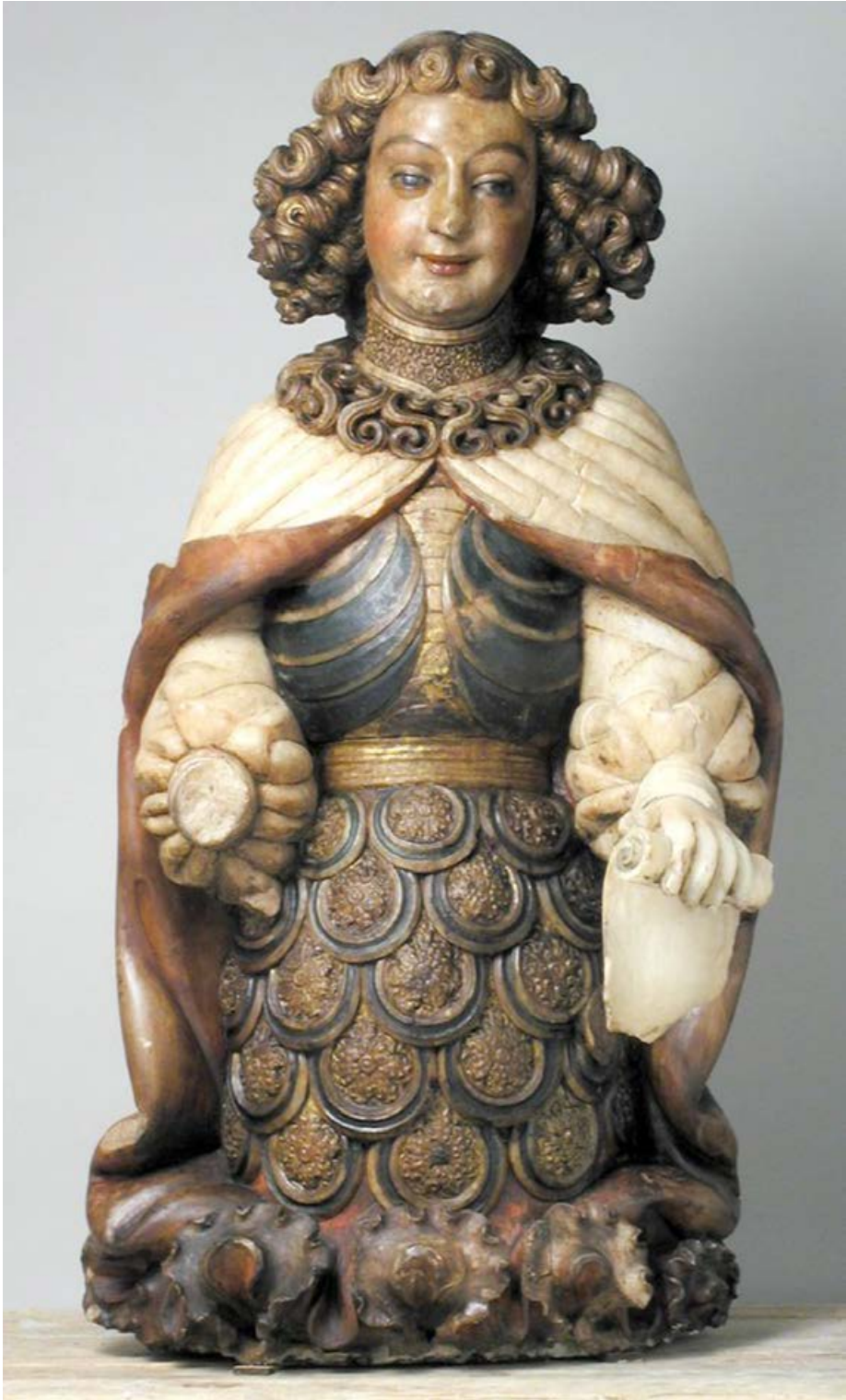
6. Pere Joan, Ángel Custodio probablemente procedente de la capilla de las Casas del Puente de Zaragoza. Museo de Zaragoza.