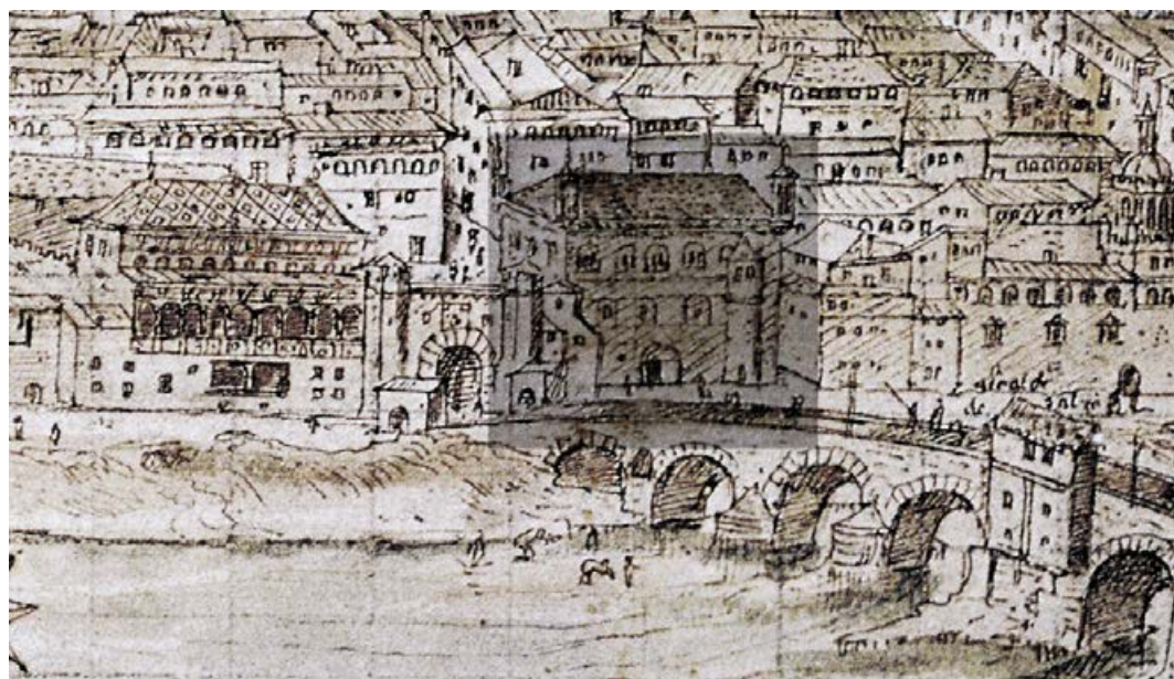
1. Las Casas del Puente de Zaragoza. Detalle de la vista de la ciudad realizada por Anton van der Wyngaerde en 1563. Biblioteca Nacional de Austria.

de Austria) [fig. 1], y Juan Bautista Martínez del Mazo (1647, Museo del Prado) [fig. 2]. 2 En ambas, y especialmente en la de Martínez del Mazo, intuimos un edificio con diferentes plantas y una fachada que se abría al río repleta de ventanales y balcones.