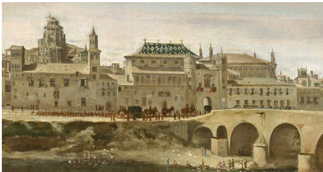
2. Las Casas del Puente de Zaragoza. Detalle de la vista de la ciudad realizada por Juan Bautista Martínez del Mazo en 1647. Museo del Prado.

tado que debía apetecerse y que había lugar á esperar en la época en que vemos alzarse por do quiera elegantes y airosos monumentos arquitectónicos, que respiran esquisito gusto y no menos belleza. La sencillez de la fachada de la Casa de Ayuntamiento, es tan escesivamente sencilla, que no ofrece materia para trazar una reseña: por lo mismo parece lo mas oportuno hacer una ligera descripción.