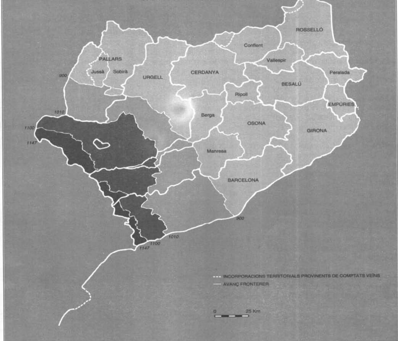
Mapa de la Catalunya comtal.

Serralada Transversal per l'est i, exclouent pel nord, l'Urgellet, el Baridà, la Cerdanya —amb l'actual Alt Berguedà— i les valls de Ribes i de Camprodon, s'aboquen a una reorganització que supera el trasbals d'Aissó i els transtorns interns. Es comença amb una densificació del poblament i de l'ocupació de l'espai agrari —beneficiant-se de corrents migratòries septentrionals i d'una progressiva meridionalització en l'aprisió de terres— i es continua per l'estructuració religiosa i política del mateix territori. No és, com tradicionalment s'hi veia, el moment de la definitiva parroquialització, però sí que n'és el d'un afermament eclesiàstic, amb la restauració del bisbat de Vic (879) i l'erecció de significatius cenobis. També ara s'incorporen espais que servaven la pròpia identitat al marge de dominis superiors, com