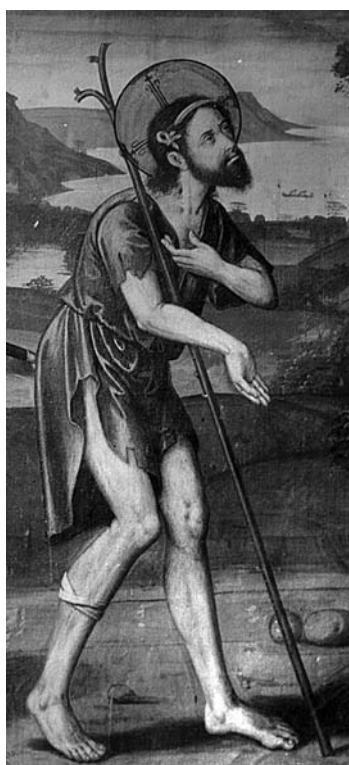
Fig. 20. Nicolau Falcó, Escena del pobre que mendiga a San Martín , detalle del pobre, sarga del retablo del gremio de armeros de la Catedral de Valencia.

jeta a Cristo (fig. 18), del retablo lazarista de la catedral valenciana. Por otro lado, es inevitable comparar el rostro del Resucitado con el que aparece en la predela del retablo citado (fig. 11) o con el Cristo de la Resurrección de la predela del retablo de la Puridad (fig. 12), aunque éste presente unas facciones más lineales, y donde vemos que todavía se utiliza el temple con ligeros toques al óleo. Finalmente, los patriarcas de la tabla de la colección barcelonesa nos remiten a los apóstoles de la escena de la Ascensión de las sargas de la Catedral de Valencia, donde la Virgen, por su postura y fisonomía, también nos recuerda a la nuestra.