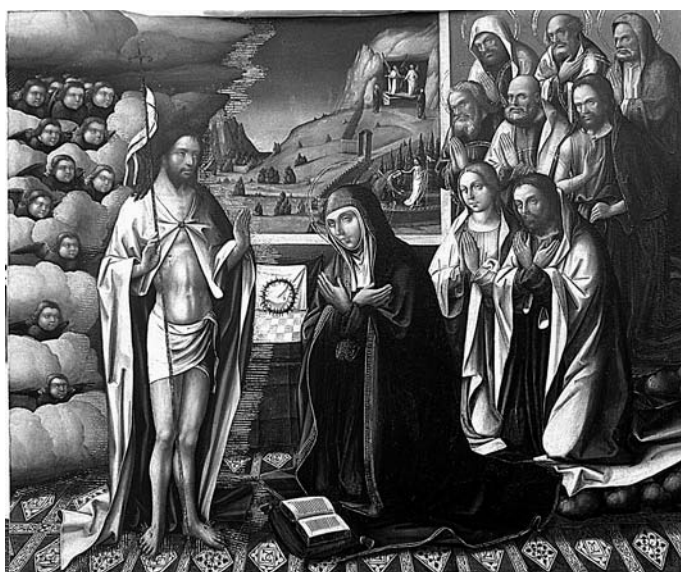
Fig. 22. Maestro de Borbotó (Martí Cabanes), Aparición de Cristo resucitado a su Madre con los Padres del Limbo , escena del Retablo de los Gozos y los Dolores de la iglesia de San Pedro de Xàtiva.

Otra de las obras que nos hablan sobre la presencia del tema fuera del entorno valenciano es una tabla de la antigua colección Parcent (Madrid), atribuida a Juan de Zamora, pintor activo en Sevilla a partir de los años veinte del siglo XVI. 114 El modelo que se sigue en esta tabla es completamente distinto a los ejemplos valencianos, y es común al de una segunda obra del entorno sevillano, un retablo anónimo de principios del XVI, conservado en el Museo de Bellas Artes de Sevilla, que en su tabla principal muestra el episodio en cuestión. 115 Llama la atención la presencia del tema en uno de los relieves del coro de la catedral de Barcelona tallados por Bartolomé Ordóñez entre 1517 y 1519, donde en una composición diferente a las representaciones valencianas del tema,