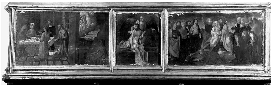
Fig. 2. Nicolau Falcó, predela del Retablo de la vida de San Lázaro, 1520, Catedral de Valencia. El cuerpo principal fue quemado en 1936.

mentación existente sobre el Retablo de la Puridad (Museo de Bellas Artes de Valencia), 15 condujo a Ximo Company a apuntar la posibilidad de identificar y unificar estos tres maestros, el de San Lázaro, el de Martínez Vallejo y el de la Puridad, en la figura del pintor Nicolau Falcó, pues observaba una evidente relación técnica y formal entre ellos. 16 Remarcaba de paso que el estilo de Nicolau Falcó estaba incuestionablemente relacionado con Paolo da San Leocadio, con quien debió formarse. 17