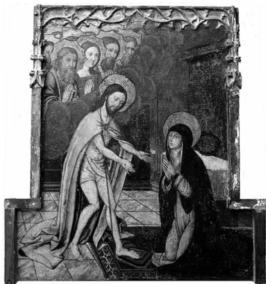
Fig. 1. Nicolau Falcó, Aparición de Cristo resucitado a su Madre con los Padres del Limbo , inicios del siglo XVI, colección particular, Barcelona.

La escena transcurre en el interior de una estancia con el solado formado a base de baldosas cuadradas jaspeadas dispuestas en perspectiva. 4 En primer plano aparece Cristo resucitado que se acerca a su madre con los brazos extendidos, como queriendo abrazarla, mientras que ella, postrada de rodillas sobre una alfombra, le mira con sus manos en actitud de plegaria. La Virgen viste túnica rojiza y manto azul que le cubre la cabeza, mientras que Jesús lleva el paño de pureza, una ampulosa y larga capa rosácea anudada con un broche, mientras sobre su antebrazo derecho se apoya la vara de la resurrección. Detrás de la Virgen, en uno de los laterales de la estancia se sitúa una mesa de altar con un brocado de fondo, y encima del mantel blanco una corona de espinas. Al fondo de la escena, en el extremo superior izquierdo, aparecen entre unas nubes grisáceas los Patriarcas, todos con sus nimbos poligonales propios de los personajes del Antiguo Testamento, y con las manos unidas como signo de plegaria.