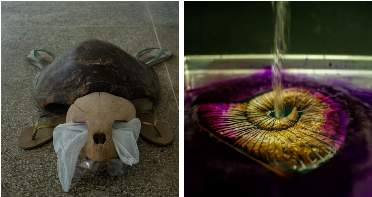
Figura 11. Poéticas do Extraordinário na UEFS.

com outras materialidades, dando aquelas vidas sacralizadas outras imagens e composições 25 .