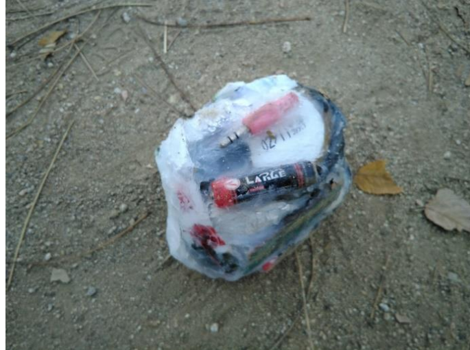
Figura 08. Pedra sedimentar contemporânea construída com os resíduos encontrados no rio.

Plásticos, papelão, cabos, chips eletrônicos, resíduos, que se derivaram em uma pedra. O grupo pensou que os arqueólogos, (aqueles que são responsáveis para o estudo sistemático dos restos materiais da vida humana extinta), no futuro iram contar nossas formas de vida através desses resíduos e lixos produzidos.