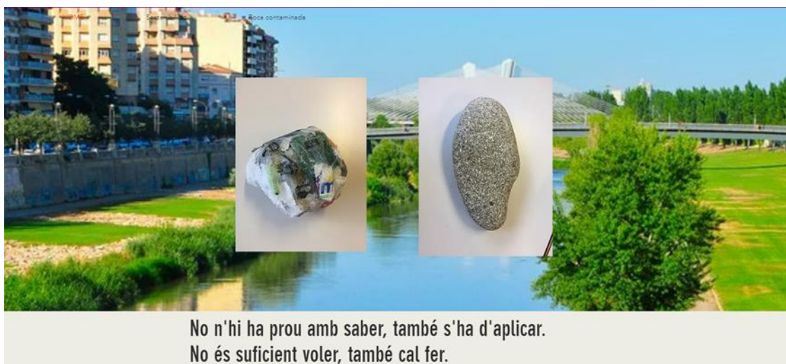
Figura 09. Captura da imagem do projeto sedimentação, do grupo "Arrels i Brots".

Para realizar este projeto os alunos tiveram que estudar sobre os processos de sedimentação, erosão, estratificação, fossilização, desde rochas sedimentares que podem ser orgânicas de animais e vegetais. As pedras contemporâneas teriam processos parecidos a rochas sedimentares através da agregação dos restos de outros materiais de processamento pelo homem 19 .