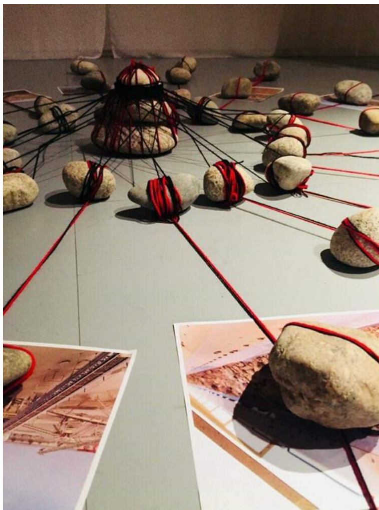
Figura 06. Mandala das pedras.

A ideia da mandala das pedras surgiu quando o menino pesquisador se deparou com várias pedras que sobraram da exposição "In the beginning was...". O menino recolheu alguns novelos de lã vermelhos e pretos, que eram utilizados por Shiota em suas obras, e aos poucos foi envolvendo as pedras dando veia primitivas, resgatando formas tradicionais de manifestar as relações da vida. A mandala era um exercício de formas e forças na tentativa de romper a dicotomia entre o vivo e o não vivo, dando as pedras veias e artérias, formando um grande sistema vivo e complexo, onde as linhas ligavam as pedras às obras dos artistas contemporâneos. Ao fundo, na parede estava sendo projetado um vídeo arte "Areia Caindo" (vídeo de uma performance de Chiharu Shiota), onde o corpo da artista se banha com areia em uma banheira. Essas diferentes obras nos convidaram a falar sobre os processos da vida, suas transformações e seus afetos.