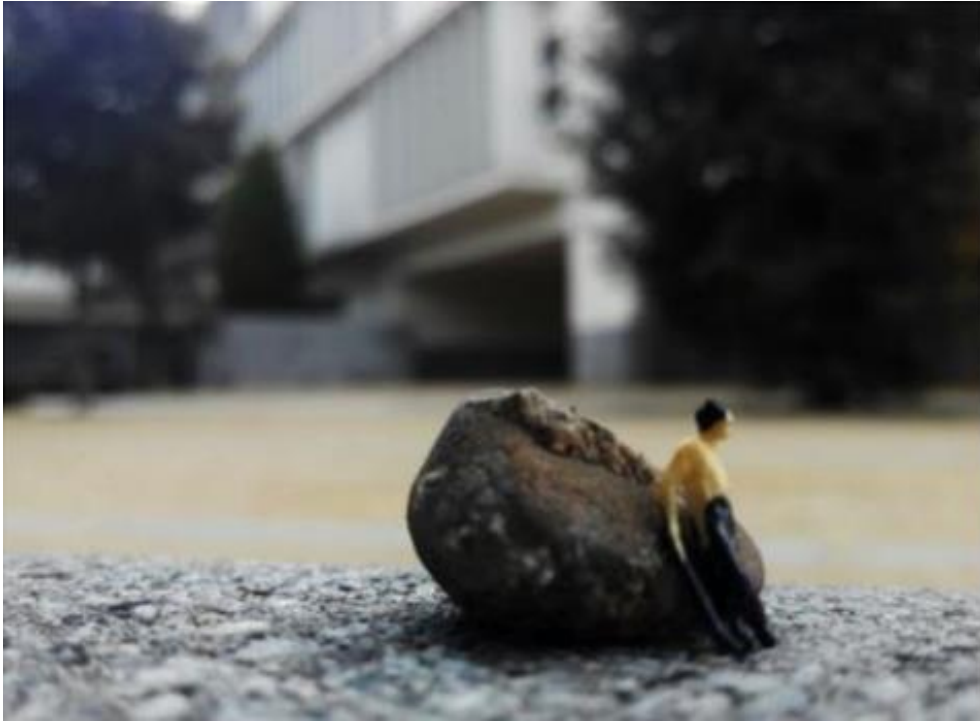
Figura 05. Ariadna Domingo, “Homem em miniatura no Campus Universitário”.

As pedras ganharam outras territorialidades ao serem deslocadas para outros discursos e narrativas onde estabeleceram diferentes relações com a materialidade das pedras e sua relação com o espaço, desafiando sua relação com o humano em diferentes escalas e composições. Contudo, as ações focavam no ensino-aprendizagem de conceitos educativos e as relações se estabeleciam somente dentro do campo da pedagogia, sem concretizar projetos e conexões com outras práticas e saberes. As ações eram muito pontuais, presa em modelos e conceitos, onde as pedras serviam apenas como metáfora para pensar as práticas pedagógicas.