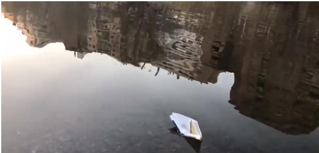
Figura 01. Rio Segre em Lleida. Imagem do vídeo arte realizado pelo grupo Arrels y Brots 6

Um encontro não por acaso entre o pequeno pesquisador argonauta e a professora das didáticas extraordinárias. O pequeno viajante tinha desejo de juntar a ciência com a arte, e nessa busca por conexões (im)próprias encontrou nas práticas educativas de uma professora que morava na Catalunha um jeito especial de fazer pesquisa, ela tinha diferentes maneiras de aproximar as práticas artísticas e pedagógicas nos contextos de aprendizagem. Para aquela professora todo lugar era lugar para aprender, desde a beira de um rio, um beco de rua, uma casa abandonada, o pátio da escola, o museu e seus arredores, todos esses espaços poderiam ser nichos de encontros improváveis entre arte, educação, filosofia e ciência.