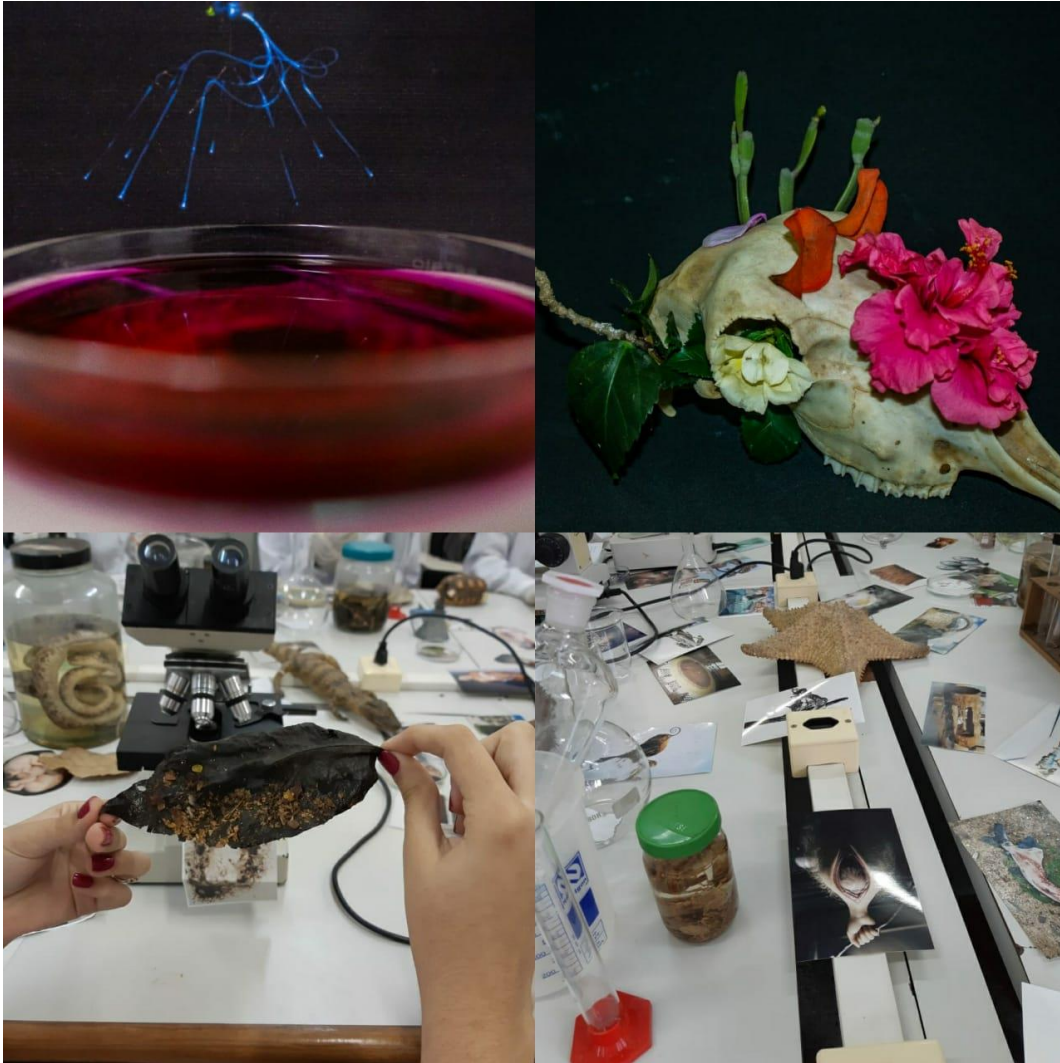
Figura 10. Práticas do laboratório do Infraordinário na UEFS.

As poéticas do infraordinário alicerçadas na Espanha agora experimentam outros movimentos no Brasil, particularmente na Universidade de Feira de Santana-BA (UEFS), onde o menino arrasta o infraordinário para compor com os resíduos de uma biodiversidade taxidermizada disposta nas prateleiras dos laboratórios de zoologia, onde as coleções e vestígios de uma natureza déjà vu querem escapar dos comportamentos de eternidade. Toda aquela natureza conservada em camadas de formol e bórax podem agora compor