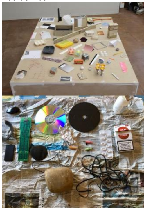
Figura 07. "Mesa prática" sobre os resíduos encontrados, um diálogo com a obra de Sean Edwards.

"Todas nosotras habiamos trabajado durante la escolarización las piedras pero no eramos capaces de dar una explicación de los procesos de formación de los guijarros y de las rocas sedimentarias. Nos sumergimos en un proceso de investigación para poder establecer relaciones entre residuos y sedimentación. El guijarro, roca sedimentaria se forma a partir de materiales sólidos que se acumulan en el fondo de los valles, de los rios, de los mares de los oceanos como consecuencia de procesos y fenómenos que afectan a la atmosfera, biosfera e hidrosfera. De la mano de Daniel canogar y su obra Vórtices con la cual hace una critica a la cultura consumista que se basa en el comprar, usar, tirar. Vórtice nos alerta del peligro de nuestra sostenibilidad por la gran generación de residuos que acaban en los rios y mares contaminando el agua. Es una obra que nos ayuda a hacer conexiones entre los residuos generados por los humanos y los sedimentos situando la acción humana como un proceso de sedimentacion provocado por la acumulación de residuos. Pusieron encima de la mesa los residuos que encontraron al lado del rio e intervinieron una de las dos piedras con ellos, creando um guijarro residual. Un cúmulo de residuos propios de las acciones cotidianas de los humanos puestos encima de la mesa para visibilizarlos, puestos en el agora, en la plaza pública, realzandolos para poder ser observados de forma distista a fin que nos empujen a tomar consciência y a cambiar nuestras formas de vida 18 "