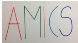
AMICS - retoladors