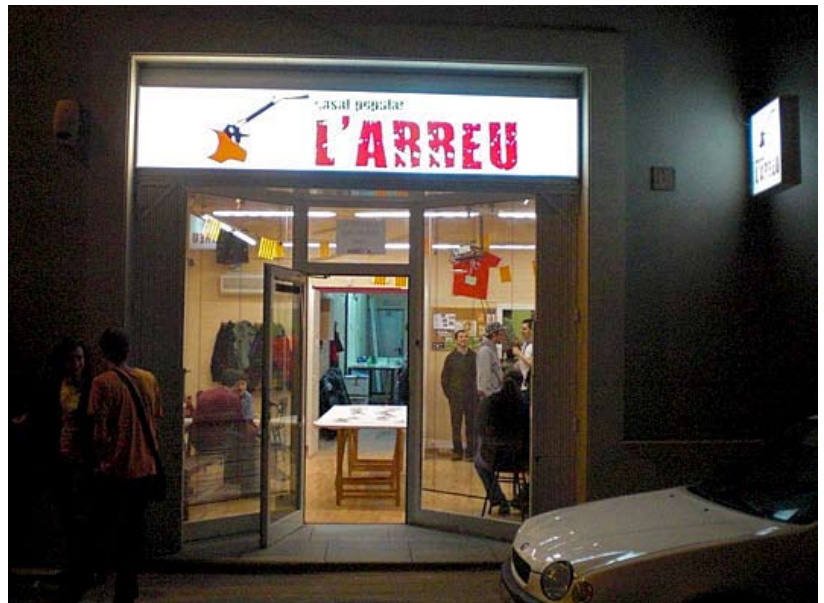
Portal del casal amb la figuració d'una arreu al costat del rètol del local. CASAL POPULAR L'ARREU

No ens enganyéssim pas: l'etnicisme alterculturalista, multiculturalista o altermundista que veiem avui profusament plasmat en l'anomenada moda ètnica , que incideix en aspectes tan i tan diversos com la música, la dansa, la