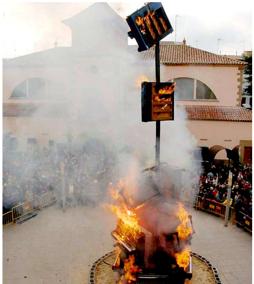
També la festa d'antor, concebuda com a creació artística, pot esdevenir una festa essencialment glocal . És l'esdevingut amb la festa del primer aniversari de la mort del pintor Guinovart, celebrada a Agramunt el 14 de desembre de 2008.

Entretinguem-nos una mica finalment en un altre camp interessant pel que fa a les reaccions glocalistes que estudiem: els marcs de sociabilitat popular. També aquí els exemples són nombrosos. Destaquem-ne dos. D'una banda, els noms de força dels col·lectius, ateneus, casals i tavernes populars de l'esquerra independentista i alternativa, actuals o amb activitat fins fa poc. Es tracta d'uns noms que denoten primigenisme rural i que signifiquen, d'acord amb les orientacions d'aquestes entitats, un palès resistencialisme antiglobalitzador. En són exemples L'Arreu (Mollerussa), La Força (Nou Barris–Barcelona–, i Carcaixent), L'Aixada (Vilanova i la Geltrú; Aldaia), La Falç (Artés; Banyoles), L'Espona (Les Borges Blanques), El Solc (Pineda), El Rostoll (Tàrraga), El Cep (Vilafranca del Penedès), L'Arboç (Arbúcies), L'Esbarzer (Palautordera), Els Escorrelots (Cardedeu), El Forn (Girona), o Cal Macarró (Calaf) (Capdevila, 2007: 74; Buch, 2007: 215-223). D'altra banda, en un altre ordre de la sociabilitat popular, la dels centres cívics, veiem a Roquetes (Nou Barris) un cas ben indicatiu de glocalisme : el nom del centre cívic, en un barri popular i perifèric de Barcelona, és el de Cal Ton i Guida . ■