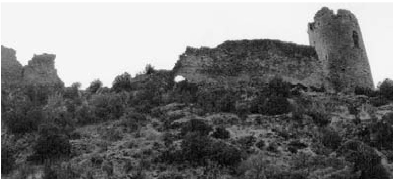
Castell de Falç. Torre mestra i secció del mur nord.

- Els castells de frontera. Situat als punts més remots de les fronteres superiors, desenvolupen una funció logística de primer ordre, atès que avituallen i acullen a l'interior l'exèrcit assaltant.