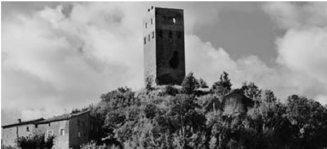
Vista panoràmica del turó i torre de Lluçars.

comtat d'Àger. Malauradament, no totes les restes dels castells dels quals tenim constància documental han perdurat fins als nostres temps. Així, a continuació, analitzarem les diferents tipologies que existeixen dels castells, dels quals, per fortuna, ens perduren actualment les seves restes —en millor o pitjor estat de conservació. En conseqüència, les tipologies resultants en funció de la planta de la seva torre serien: