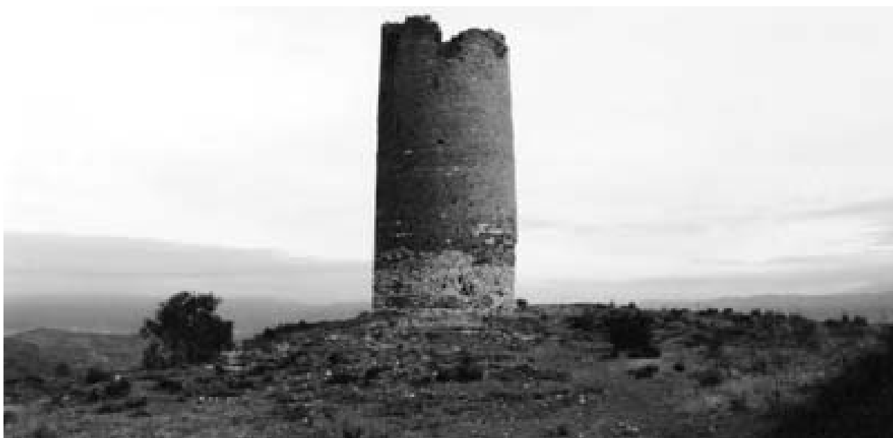
Torre de Viacamp, situada entre les aigües dels rius Noguera Pallaresa i Queixigar.

murs d'uns 2,15 m. El nivell inferior era utilitzat com a magatzem. Al primer pis trobem la porta d'accés, a 4,5 metres d'alçada i orientada cap al sud. En els altres dos nivells superiors, que es troben en un estat ruïnós considerable, trobem l'existència de diverses obertures. Com en els exemples anteriors, aquesta torre posseïa un recinte annex que s'estén cap al sud-est del turó.