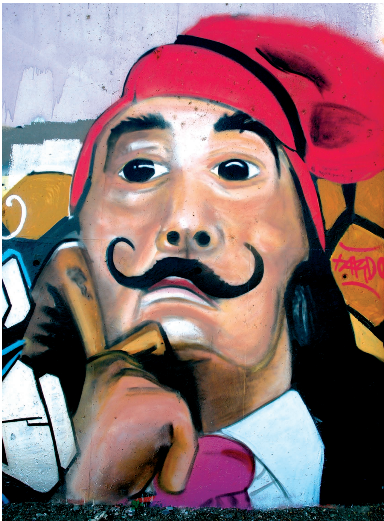
Efimer grafit (Pardinyes, abril 2007).