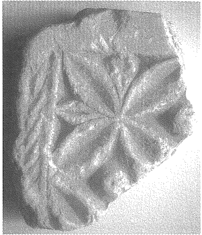
Fig. 1. Fragment de cancell visigòtic de Lleida, amb decoració per les dues cares.

La peça és de marbre blanc però en ser trobada presentava una patina adherida de color marronós. En la restauració, duta a terme al Laboratori d'Arqueologia de la Universitat de Lleida, ha rebut un tractament de neteja, eliminant les restes de terra i concrecions adherides mitjançant procediments químics. Amida 20 x 23,3 x 6,5 cm i conté decoració tallada a bisell per les dues cares. En una d'elles s'hi aprecia perfectament que el fragment es correspon a un dels extrems d'una peça de majors dimensions, perquè una franja en angle recte emmarca la resta de la decoració. En un dels dos costats laterals s'hi distingeix un enfonsament de secció circular que suposem que