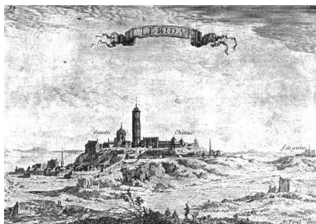
Lleida al segle XVII. El mateix plànol a l'obra Les plans et profils des principales villes et lieux considérables de la Principauté de Catalogne , reedició de l'obra de Beaulieu, 1707.

La reacció de la uninacionalisme, dirigit pel rei i el Govern del Partit Popular, davant els sobiranistes encapçalats per Carles Puigdemont, que van aplicar la DUI (Declaració Unilateral d'Independència) el 27 d'octubre de 2017, ha estat contundent (càrregues policials desproporcionades el dia del referèndum de l'1 d'octubre, presó per als polítics implicats i aplicació de l'article 155 de la Constitució que suspèn el Govern de la Generalitat el mateix 27 d'octubre), i mostra com de profund és el