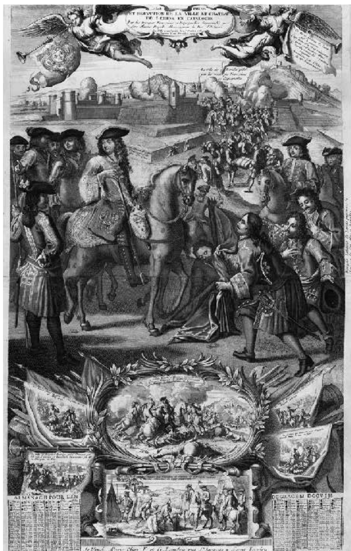
Preses de Lleida pel duc d'Orleans el novembre de 1707. Biblioth que Nationale de France (Estampes, Hennin 7171). Fons Sol-Torres de la UdL.

l'octubre de 1701 al gener de 1702, en les quals fins i tot va donar perm s a Catalunya per enviar dos vaixells a Am rica des dels seus ports. L'acte de Felip va ser considerat per molts com un brindis al sol, ja que molt aviat la pol tica del seu virrei a Catalunya no es va ajustar al seu jurament.