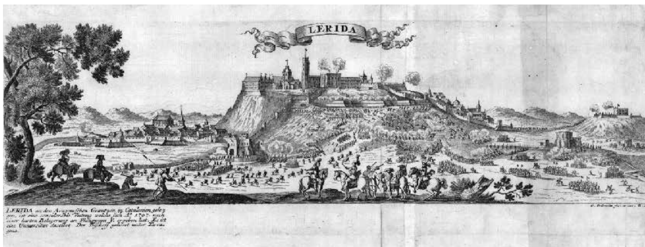
Lleida el 1707. L rida an den aragonischen graetzen in catalonien gelegen, ist eine considerable vestung welche sich A o 1707.

I  s que en el cas concret de Catalunya, des de sempre, Felip va ser vist com un rei franc s, i aix  al Principat era sin nim de desconfian a, sobretot perqu  des de la segona meitat del segle XVII s'havia desenvolupat un gradual sentiment franc fob arran de la mutilaci  del seu territori pel Tractat dels Pirineus de 1659. Per un altre cant , l'arxiduc Carles, des del mateix dia que va desembarcar a Barcelona, el 22 d'octubre de 1705, fou acollit amb molta simpatia. L'arxiduc va jurar les constitucions catalanes el 7 de novembre de 1705 i va ser proclamat rei amb el nom de Carles III. Davant aquesta conjuntura, una de les primeres mesures que va prendre va ser la convocat ria de les Corts Generals, en les quals va donar suport al model pactista