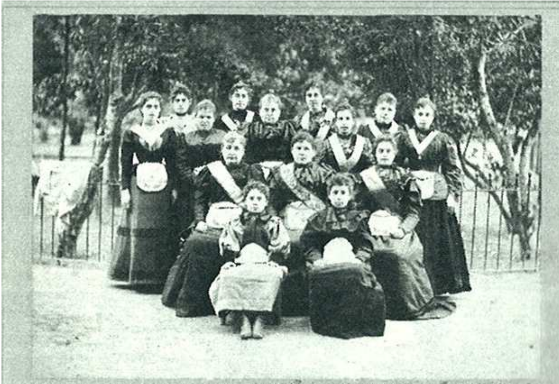
Dones iniciades en la lògia Hijas de la Unión de València a finals del segle XIX

*Extret de Mujeres masonas en España. Diccionario Biográfico (188-1939)