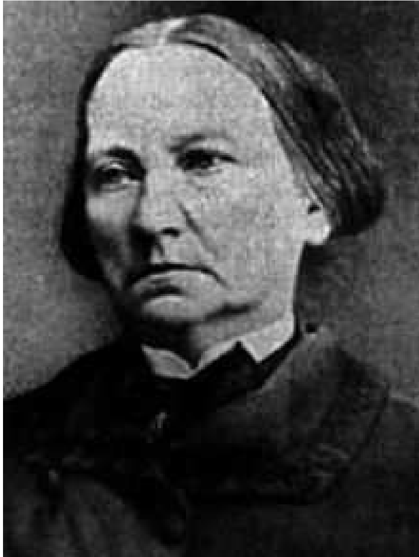
Retrat de Concepción Arenal