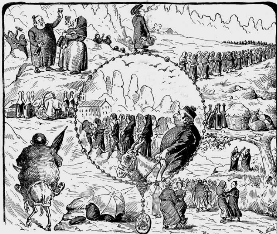
Com ab las darreras plujas hi ha per tot herba abundant,