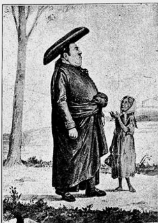
Un mossén de pes.