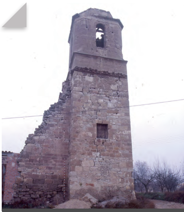
Fig. 10 - L'emblemàtica estructura del campanar des del sud.

Per la banda sud i oest, no hi resta més que una paret de tanca moderna feta en bona part amb elements constructius de l'edifici desaparegut, els quals es poden identificar fàcilment, alguns motllurats o amb marques de picapedrer. Per l'entorn es localitzen encara pedres treballades que demostren la riquesa d'aquella edificació.