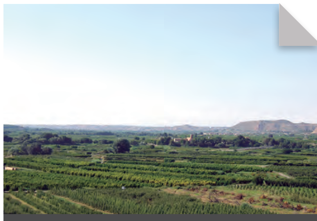
Fig. 2 - El monestir de Santa Maria d'Escarp al mig de l'horta del Baix Segre.

El monestir de Santa Maria d'Escarp és molt probablement un dels elements patrimonials més desconeguts del Baix Segre, tot i que el perfil del seu campanar continua sent un referent per als veïns i passavolants, així com la resta millor conservada de la vella construcció conventual, encara que la coberta ja està parcialment enderrocada. No hi ha dubte que l'oblit generalitzat del monestir cistercenc està motivat per dues raons: per una banda, el fet que continuï en diverses mans privades des que fou desamortitzat al segle XIX i, per l'altra, el nou pont sobre el Segre, que deixa el vell com un record marginal, juntament amb la corba marcada de la carretera que envoltava per l'oest i el sud la construcció cistercenca, la qual ara resta relativament allunyada de la nova variant que s'enfila recta cap al nou pont.