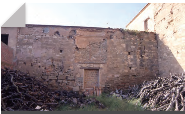
Fig. 8 - Paret meridional corresponent a l'única part que es conserva del monestir medieval. S'observa clarament l'encaix del presbiteri barroc de l'església feta al segle XVIII.

El cos que segueix cap al nord mostra una estructura diferent: és més baix i correspon a una ala clarament afegida, feta de murs de tàpia pel nord i per l'oest, amb diverses finestres a la part superior, cosa que permet identificar-lo amb cel·les monacals, i la part baixa molt més tancada, que seria per aixoplugar-hi serveis; la façana est ha estat totalment alterada en època recent per una paret de totxana. De la cantonada nord-oest parteix una tanca de tàpia que envoltaria tot el monestir i que, per la banda occidental, fou aprofitada com a defensa en les carlinades i també en la passada guerra civil, segons es veu pels forats triangulars oberts, però que, malauradament, ha estat retallada recentment en la seva alçària de prop de quatre metres.