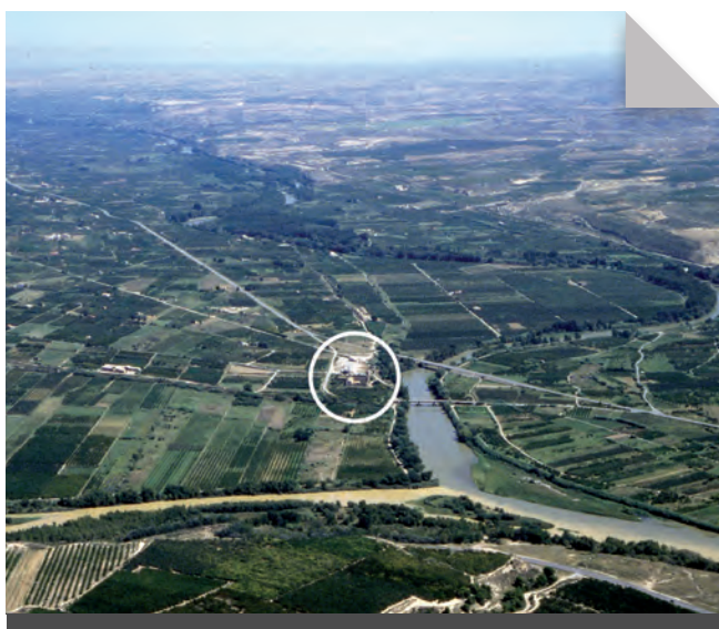
Fig. 1 - Vista aèria de l'aiguabarreig del Cinca, esquerra, amb el Segre, dreta, en què destaca la situació del monestir d'Escarp.

La confluència del riu Cinca amb el Segre es produeix pocs quilòmetres abans que aquest s'uneixi amb l'Ebre a la propera Mequinensa; la circumstància que aquest darrer tram esdevingui cua de l'embassament de Riba-roja dona un valor natural excepcional a tota la zona que és coneguda formalment com l'Aiguabarreig. Precisament les restes del vell monestir d'Escarp es troben presidint la unió dels dos primers rius, però el fet que sigui a la dreta del Segre n'ha motivat la pertinença municipal a Massalcoreig, població més llunyana que la Granja, que té l'afegit al topònim d'Escarp i que és molt més propera i sempre ha estat vinculada amb la història de la vella casa cistercenca, però situada a l'esquerra, és a dir a l'altra banda del riu Segre. Cronologia del Cister a la Catalunya Nova