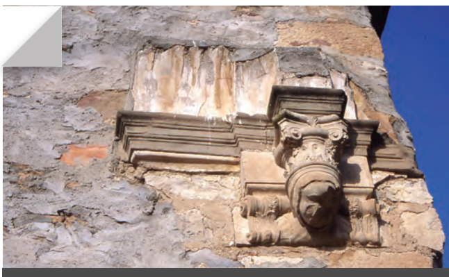
Fig. 7 - Detall de mènsula barroca.