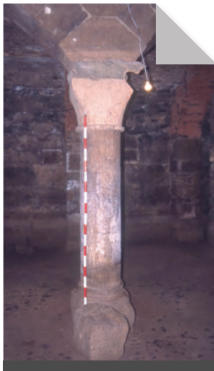
Fig. 12. Columna del segle XIII del celler del monestir.

A sota del primitiu cos del monestir es conserven les restes més desconegudes d'Escarp, ja que es tracta d'un celler del més pur estil cistercenc amb dos arcs apuntats seguits que parteixen l'estança en dues meitats, sostinguts al mig per una columna de fust llis, basa àtica i capitell troncocònic també llis, i als extrems la mateixa estructura embeguda als murs. Hi ha d'altres elements d'interès i també s'aprecia el caneller d'un trull que indica clarament la funció d'aquest àmbit soterrat, que mostra una volta de maçoneria, en algun punt reforçada amb arcs de totxana, i que cal relacionar amb la reforma realitzada amb les obres d'arranjament del monestir en època barroca.