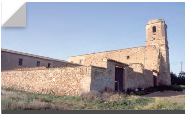
Fig. 11 - Vista general del monestir d'Escarp des del sud-oest. (Fot. Servei d'Arqueologia.)

A sota del primitiu cos del monestir es conserven les restes més desconegudes d'Escarp, ja que es tracta d'un celler del més pur estil cistercenc amb dos arcs apuntats seguits que parteixen l'estança en dues meitats, sostinguts al mig per una columna de fust llis, basa àtica i capitell troncocònic també llis, i als extrems la mateixa estructura embeguda als murs. Hi ha d'altres elements d'interès i també s'aprecia el caneller d'un trull que indica clarament la funció d'aquest àmbit soterrat, que mostra una volta de maçoneria, en algun punt reforçada amb arcs de totxana, i que cal relacionar amb la reforma realitzada amb les obres d'arranjament del monestir en època barroca.