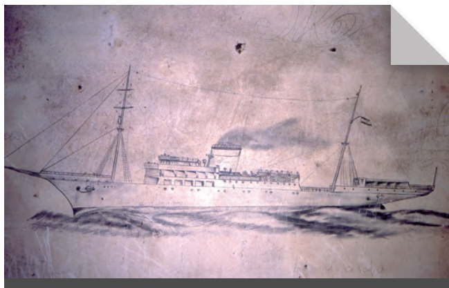
Fig. 4 - Curiós grafit d'un vaixell mercant.