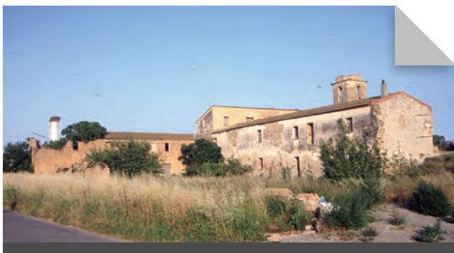
Fig. 6 - Vista general del monestir d'Escarp des del nord-oest.