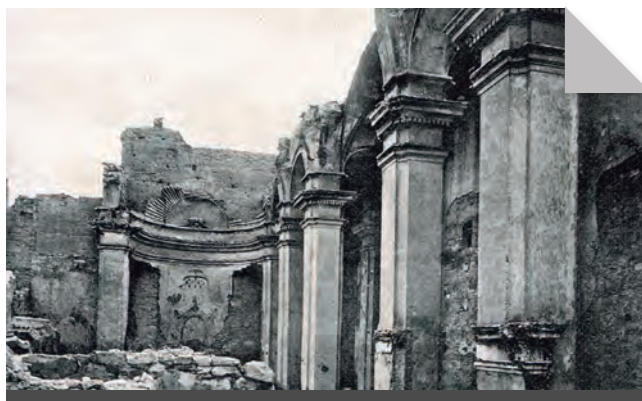
Fig. 9 - L'any 1898 es conservaven encara aquestes restes de l'església feta al segle XVIII. (Fot. Gaietà Barraquer publicada a "Las casas...")

El cos que segueix cap al nord mostra una estructura diferent: és més baix i correspon a una ala clarament afegida, feta de murs de tàpia pel nord i per l'oest, amb diverses finestres a la part superior, cosa que permet identificar-lo amb cel·les monacals, i la part baixa molt més tancada, que seria per aixoplugar-hi serveis; la façana est ha estat totalment alterada en època recent per una paret de totxana. De la cantonada nord-oest parteix una tanca de tàpia que envoltaria tot el monestir i que, per la banda occidental, fou aprofitada com a defensa en les carlinades i també en la passada guerra civil, segons es veu pels forats triangulars oberts, però que, malauradament, ha estat retallada recentment en la seva alçària de prop de quatre metres.