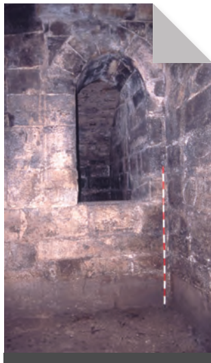
Fig. 13. Un altre element del celler.