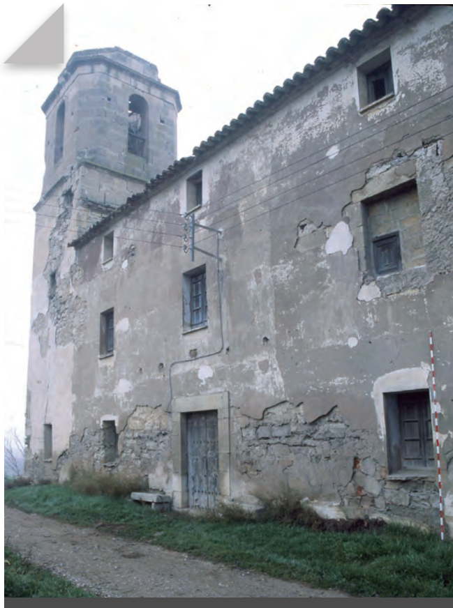
Fig. 3 - La façana oriental és un dels elements millor conservats del vell monestir.