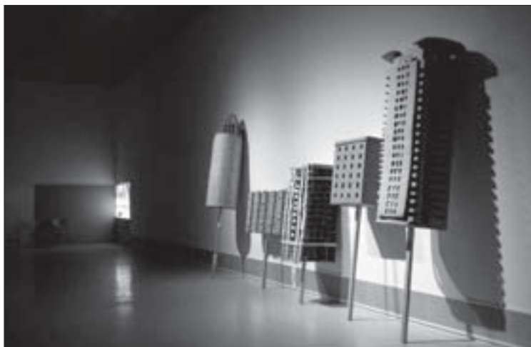
Imagen 2. Exposición «Jordi Colomer». Centro de Arte La Panera, 2009

de la obra de Jordi Colomer y de la ciudad (imagen 1). En el marco del proyecto «Alber» del CEIP Príncep de Viana (Jové y otros, 2006) se trabajó la conmemoración de los 800 años del nacimiento del rey Jaume I. Se partió de una exposición que se realizó en el Institut d'Estudis Ilerdencs (IEI) de la Diputació de Lleida «Escenes imaginàries del Rei». En educa-