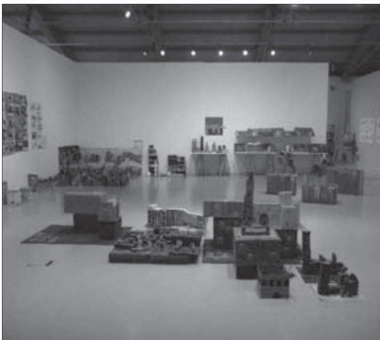
Imagen 5. 8.ª edición de Jornadas de Puertas Abiertas. Centro de Arte La Panera, 2009