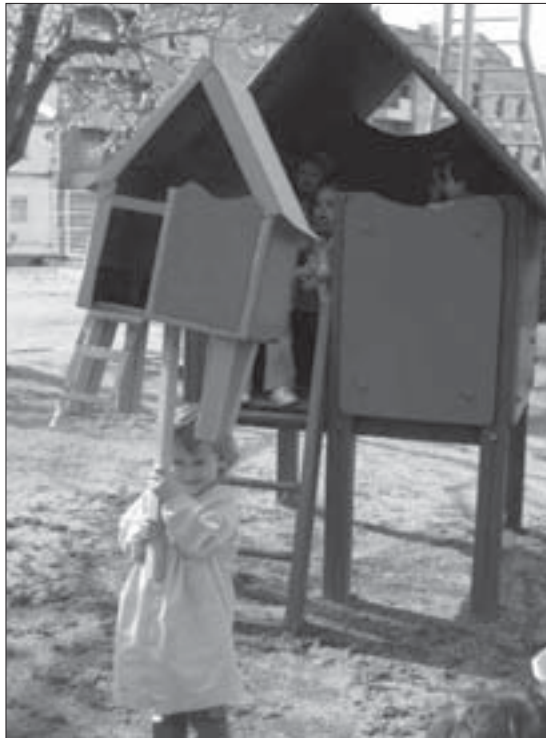
Imagen 1. Escola Bressol Municipal Secà de Lleida (curso 2009-2010)