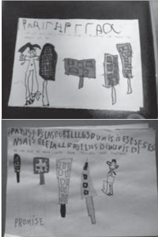
Imagen 3. Dos ejemplos de producciones en dibujo de los niños y las niñas del ciclo de infantil