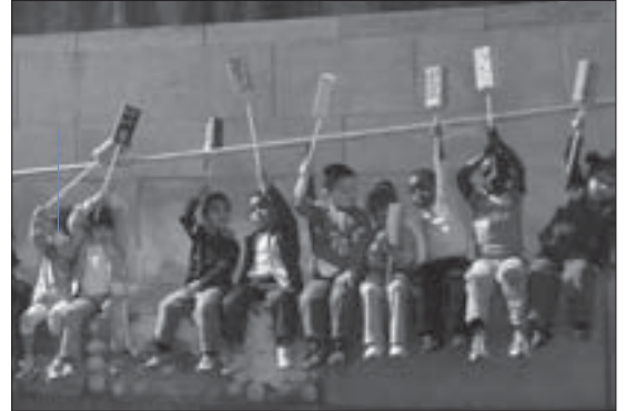
Imagen 4. Salida por el barrio de los niños y las niñas del ciclo de infantil