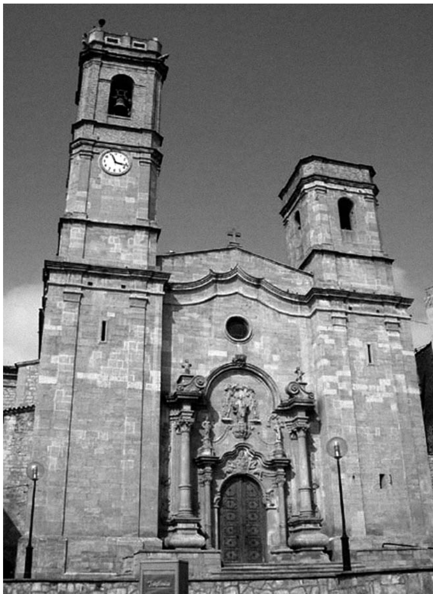
Església de Sant Antolí (Aitona).

en antigues torres de defensa o palaus de petits nuclis habitats musulmans. Els dos principals exemples són la comentada ermita de Carrassumada, a Torres de Segre, i la de Sant Joan de Carratalà, als afores d'Aitona en direcció a Seròs. Ambdues són construccions cristianes medievals, que aprofitaren restes d'edificis andalusins i dominen extenses i excel·lents vistes de la zona del Baix Segre.