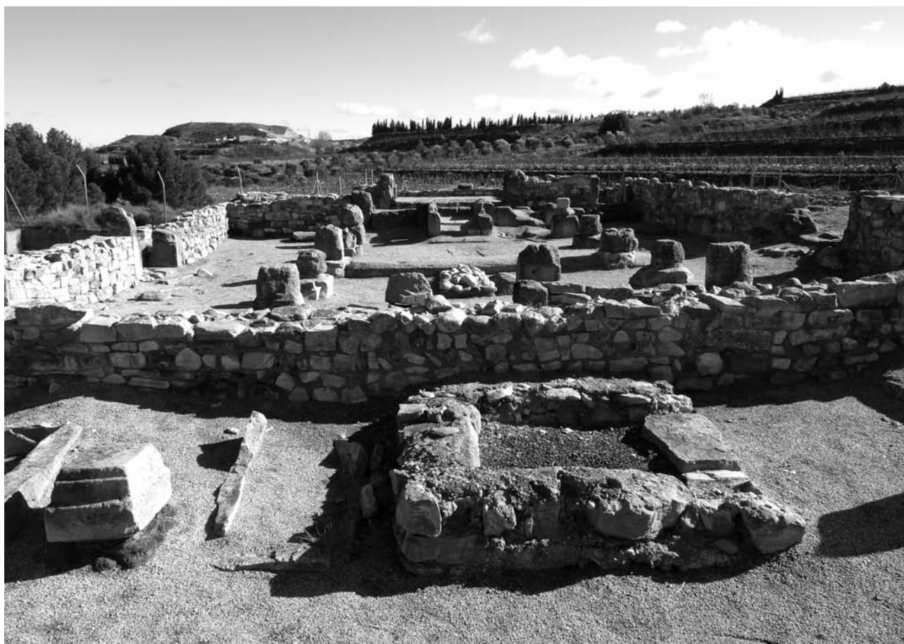
Poblat visigòtic el Bovalar (Seròs).

duir-hi l'aigua del reg, és dominat per espècies perennifòlies i esclerofil·les. Aquest paisatge autòcton es mostra sobretot a les parts elevades del nord-oest de les poblacions, al marge dret del riu Segre i cobreix la rereguarda de les poblacions. Aquesta zona està dominada per serres àrides, la més important de les quals és la serra Llarga, amb poca vegetació, que manifesten una continuïtat amb les comarques subdesèrtiques d'Aragó. Altrament, a la part baixa, al costat del riu, hi ha una important xarxa de regadiu integrada pel canal d'Aragó i Catalunya, i diverses séquies que duen aigua del Segre, com les de Remolins, Aitona i Seròs. En aquest territori s'ha desenvolupat el conreu de fruita dolça, font econòmica principal dels seus habitants i de bellesa fotogràfica amb l'esclat florit de la primavera. Per als amants de la fotografia, recomano visitar la zona sobretot al març i a l'abril de cada temporada, quan els camps llueixen en la seva màxima esplendor. La millor atalaia per contemplar el paisatge florit dels fruiters del Baix Segre ens la dona el tossal de Carrassumada, a 2,5 km de Torres de Segre, al cim del qual hi ha l'ermita del mateix nom.