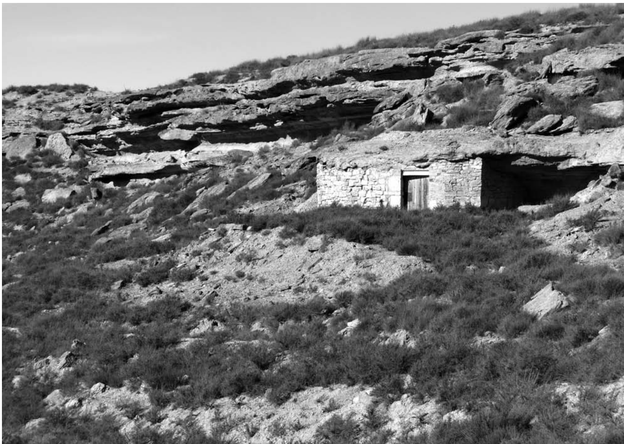
Paisatge de serra des de Gebat (Soses).

ta del Baix Segre, reconeguda i exportada internacionalment, ha propiciat el seu desenvolupament econòmic durant l'últim terç del segle XX i principis del XXI.