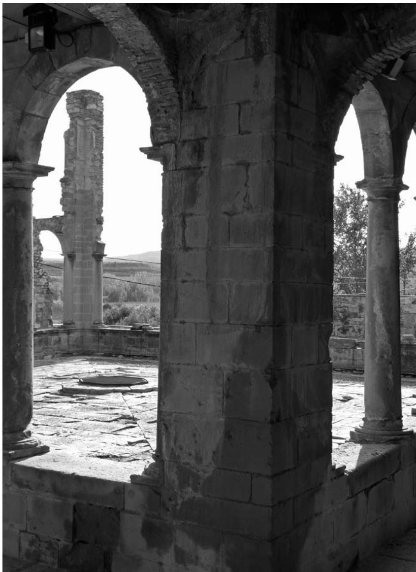
Monestir d'Avinganya (Seròs).

Aquest llegat patrimonial del Baix Segre mostra el contrast entre les restes patrimonials cristianes i musulmanes conservades en alguns dels seus municipis. D'una banda, a la vila d'Aitona, com a representant de la comarca catalana amb més influència musulmana, amb una presència que s'allargaria fins a l'expulsió dels moriscs, en 1609. El nucli antic d'Aitona es mereix una visita amb calma per descobrir el barri de la Moreria, que conserva un dels vestigis medievals més grans del pas dels àrabs per Catalunya, fins al punt que en 1961 es trobà en una casa un manuscrit de narracions aljamiadomoriscques. L'edifici principal del conjunt musulmà és la Casa del Rei Moro, declarada bé cultural d'interès local, la qual disposa d'elements arquitectònics característics, com ara els arcs de sota coberta o la galeria i els ràfecs a la part superior de l'edifici. D'època medieval, és interessant el carrer del Forn, format per dos passatges, amb una entrada emmarcada per arcs de mig punt rebaixats i una sortida per dos arcs ogivals. El carrer està cobert per bigues de fusta amb revoltos. La visita del poble ha de cloure dalt del turó de la vila per observar les restes medievals de l'antic castell dels Montcada, marquesos d'Aitona, i una vista excel·lent del poble en contrast amb el paisatge de les serres properes.