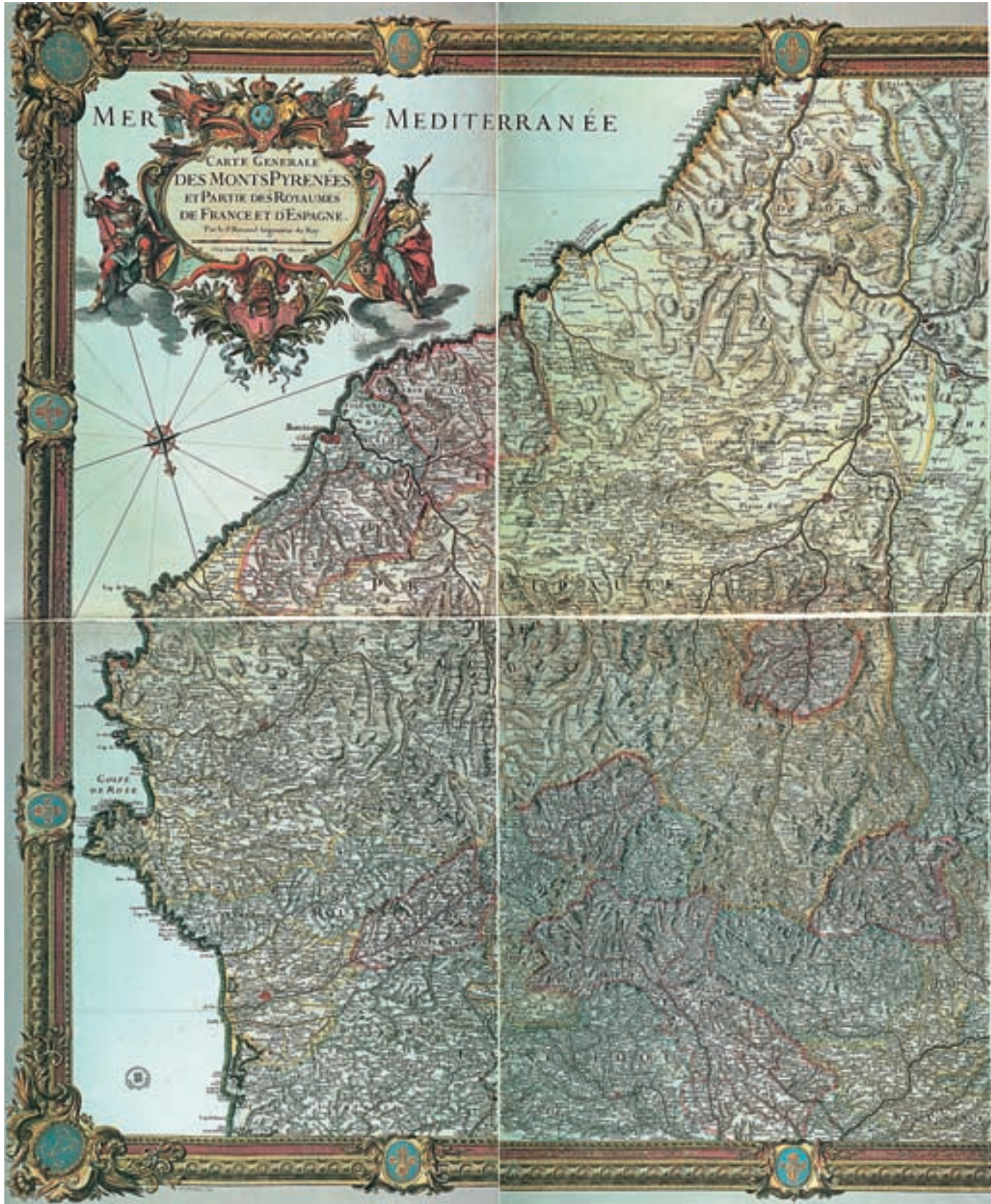
Figura 3. Roussel i La Blotière: Carte Generale des Monts Pyrenées et Partie des Royaumes de France et d'Espagne .