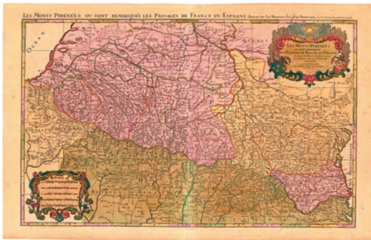
Figura 1. N. Sanson [1675]: Les monts Pyrenées ou sont remarqués les passages de France en Espagne , Amsterdam, Pierre Mortier.