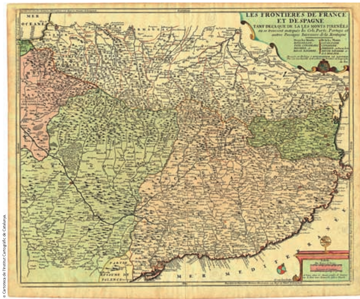
Figura 2. Nicolas de Fer [1694]: Les frontieres de France et d'Espagne tant deça que de la les monts Pirenées... , Paris, G. Danet.

Per a la realització del mapa de conjunt, a escala aproximada 1:216.000, fou necessari el suport de mapes que permetessin situar en un marc geogràfic més ampli la informació dels originals fets a escala gran. Per a l'Aragó, el mapa de Lavanha continuava essent el document bàsic de referència. En el cas de