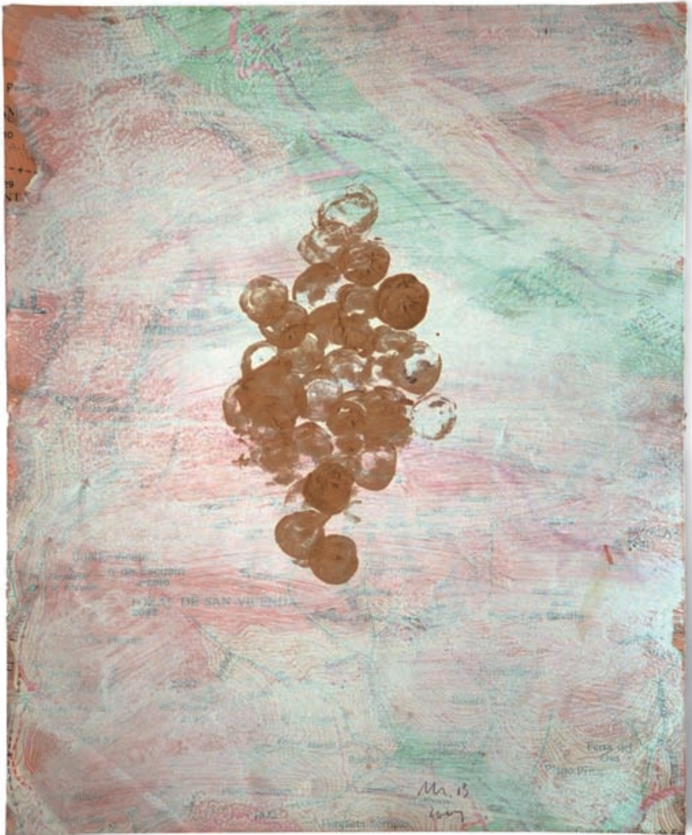
Manuel Bellver. Els fruits de la contemplació (sèrie de 6 dibuixos). 2004. Aiguada i pintura d'or sobre paper imprès en òfset. 21,4 x 17,5 cm.