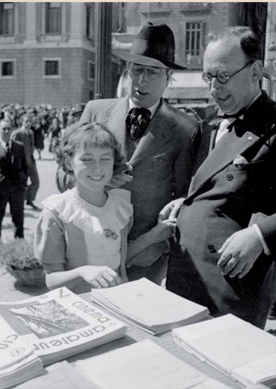
Pau Vila i la seva néta el dia de Sant Jordi de 1936 a la plaça de Sant Jaume.

Doctor en geografia, professor de la Universitat de Lleida i responsable del Servei científicotècnic de Cartografia i SIG