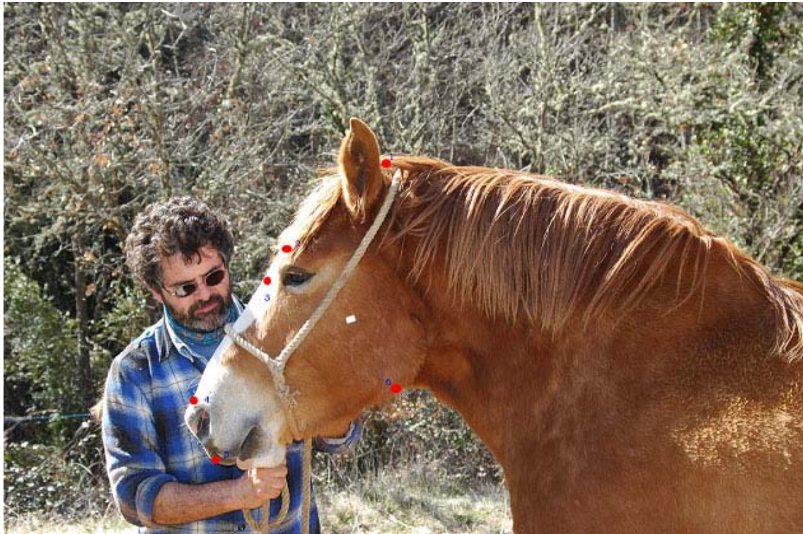
Figura 1. Referencias topográficas externas para la medición de las diversas variables lineales