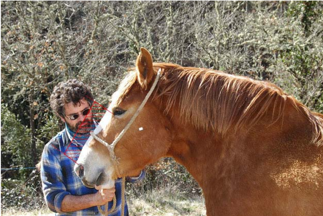
Figura 2. Proyección sobre imagen de las dos líneas verticales, unidas por un trazo a 8 cm del plano cefálico

A partir de esta variable se ha obtenido el Índice de Perfil Nasal (IPN), obtenido como la relación porcentual entre VPN y LN. El hecho de trabajar con un índice nos permite minimizar la influencia del tamaño de la cabeza (que en este caso se reflejaría como longitud nasal). El interés añadido de trabajar con índices es que algunas variables que de forma individual y aislada pueden no manifestar poder discriminante, sí lo pueden presentar en un índice, al acumularse la información de las dos variables utilizadas en la confección del índice.