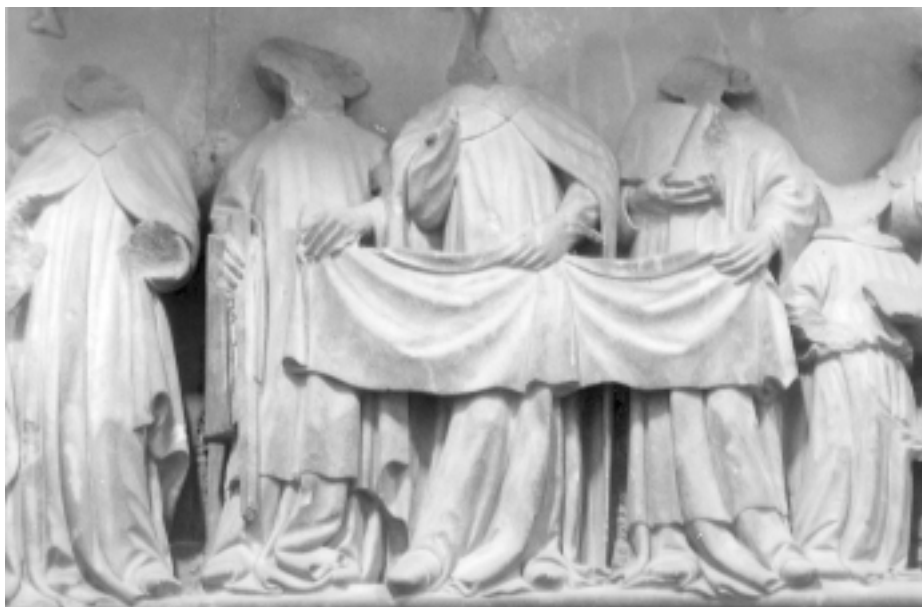
Fig. 11 Detall de les Exèquies. El bisbe oficiant