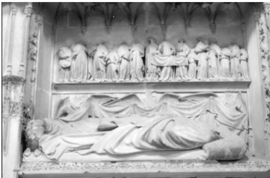
Fig. 7 Detall de les exèquies i la figura jacent