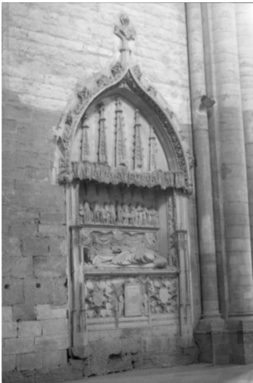
Fig. 2 Monument funerari de Berenguer Barutell. Visió de conjunt