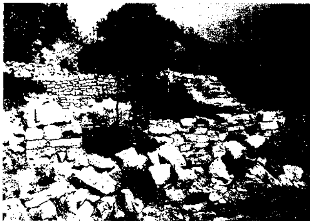
Figura 4. Habitatge central i porta d'accés a un dels habitatges del sector W de Sant Llorenç d'Ares. Observeu la presència de la llar de foc central.

2) La segona línia està distribuïda en sentit paral·lel a la muralla, sobre la qual recolza, i s'aprofita el mur per fer-hi aguantar la teulada. Algun d'aquests habitatges té serveis annexos, sempre molt tardans (finals del segle XIII o principis del XIV), com s'esdevé a la casa C, de dues habitacions i que disposa d'un servei de clavegueram obert a l'exterior de la muralla. Com en el cas de la primera línia de cases, també aquí hi ha un nivell del sòl molt irregular que permet la formació d'un celler i una entrada al primer pis a peu pla des del carrer central del poblat.