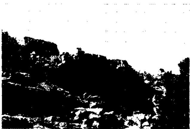
Figura 2. Castell i església castral de Sant Llorenç d'Ares, vistos des de la zona meridional, protegida per l'espadat natural de roca.

L'església romànica és d'una sola nau, situada a l'est del castell i perfectament orientada en sentit E-W. Té un parament similar i coetani al del castell, amb elements decoratius propis del romànic llombard; es tracta d'una nau coberta amb volta de canó i arcs de reforç. L'església, com el castell, estan situats al mateix nivell i a la zona més alta del penyal sobre el qual s'assenta el poblat medieval. Aquesta ubicació conjunta —castell i església— contrasta amb el que s'observa en altres poblats de la mateixa vall, on l'església o bé és al centre o bé a la zona inferior del poblat.