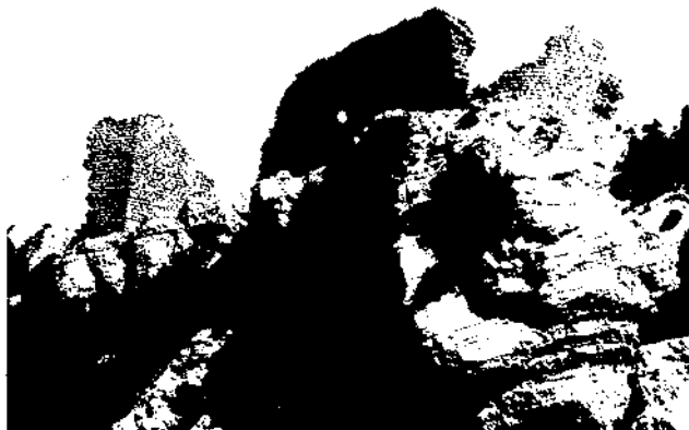
Figura 3. Mur d'un dels habitatges de la zona superior, proper al castell i a l'església.

La part destinada a hàbitat està situada a la falda del monticle, vers la cara nord que mira i és protegida per la serra del Montsec. N'és característica l'adaptació al relleu del terreny, que s'aprofita de la forma més convenient, entre els segles XI i XII —etapes de construcció del poblat—. Els nivells de les distintes habitacions es salven —vegeu el plànol— combinant les entrades i les sortides de les cases amb escales de fusta o de pedra. D'altra banda, la importància determinant del clima es reflecteix en un lloc de vents predominants de l'Aragó (de l'oest), i això fa que els habitatges se situïn i s'amunteguin preferentment a l'est, on hi ha la porta d'entrada al conjunt.