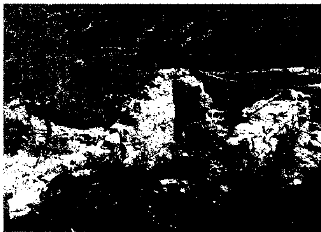
Figura 5. Aljub o trull ubicat a la zona superior del conjunt urbà.

En segon lloc cal destacar la xarxa de carrers (assenyalats al plànol amb línies de punt i ratlla), perfectament traçats, amb un gran eix horitzontal en sentit E-W, una plaça central (K) que actua d'espai lliure, ampli, pla i destinat a distribuir les connexions, ja que d'allí parteixen els dos camins, vers l'església i vers el castell. Justament en aquesta plaça s'hi ha instal·lat un servei col·lectiu de recollida d'aigües o dipòsit, segurament de darreries del segle XIII.