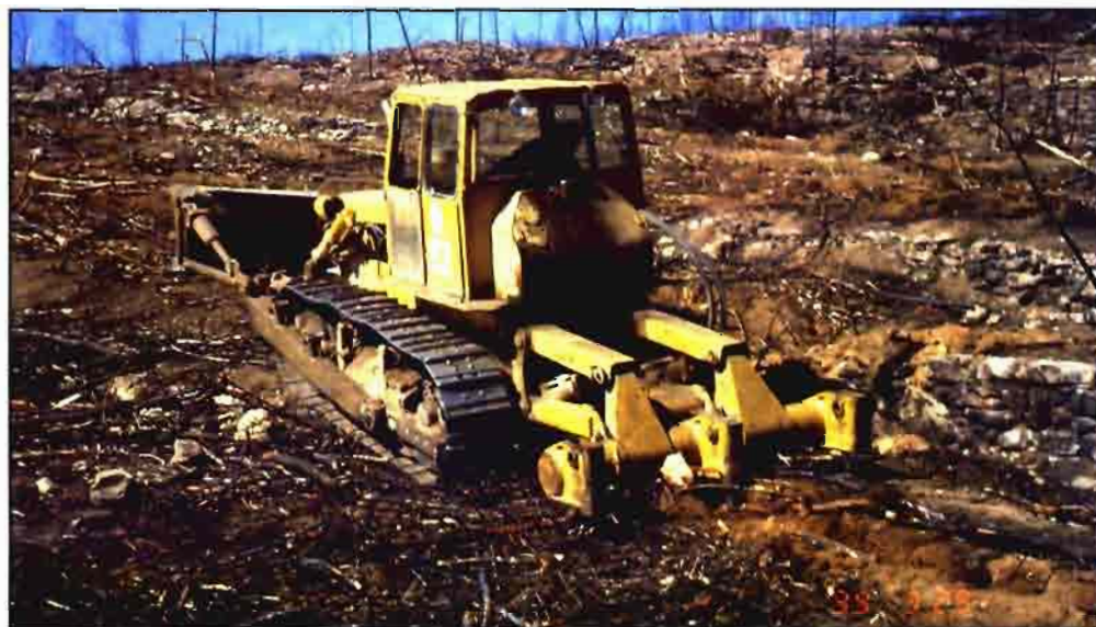
Equipo de cadenas realizando trituración previa a la plantación.