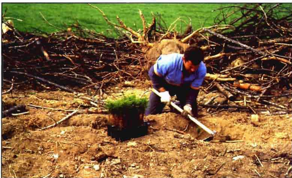
Ejemplo de plantación manual.

especialmente el coste final del método; para una plantación de 400 pies/ha, el subsolado lineal a 5 m y el ahoyado con barrena son preferibles frente a los ahoyados con ripper o con retroexcavadora (gráfico 1).