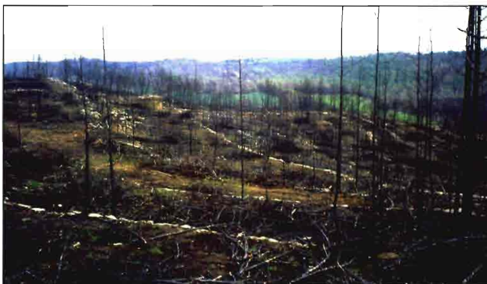
Sobre estas líneas una zona de la comarca del Bages (Barcelona), donde se realizaron las pruebas.

J. Arnó; E. Correal; J. Masip. Departamento de Ingeniería Agroforestal. Universidad de Lleida