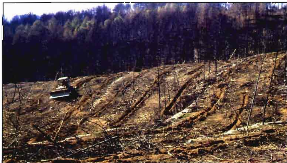
Realización de subsolado previo a la plantación.