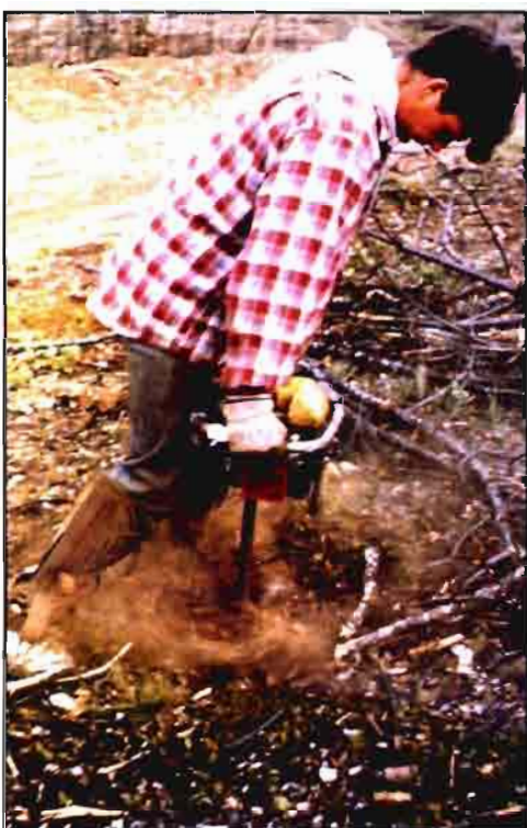
Ahoyado con barrena.

1. Independientemente de que se realice o no la eliminación (trituration) de los restos del incendio, los procedimientos que optimi-