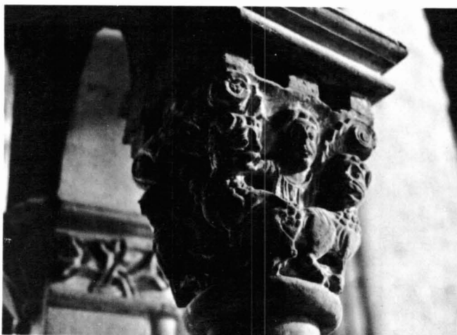
Figura 4. Trifori de Sant Feliu , Girona, Capitel·l núm. 5.

L'adscripció de l'escultura del trifori en aquesta part de la capçalera a repertoris de tradició gironina no sempre però és tan clara. Això i la manca d'homogeneïtat estilística en un grup relativament reduït de peces, dificulta una explicació per aquests capitells de Sant Feliu. Cal tenir present, a més, que les impostes de les finestres del trifori de l'absis i del presbiteri en resten molt allunyades, essent, com les de la nau, ja plenament gòtiques. 31 Aquest fet fa pensar en una possible reutilització que també explicaria les diferències de tamany de les columnes, per exemple. 32 La informació al respecte però és nul·la i, per tant, és pràcticament impossible conèixer-ne la seva destinació originària.