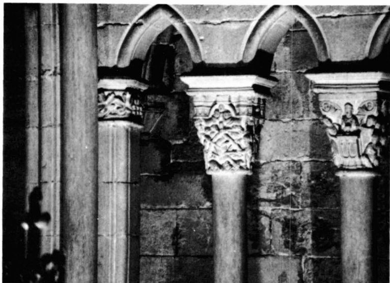
Figura 5. Trifori de Sant Feliu , Girona, Capitells 6 i 7.

Pel que fa doncs a aquest grup de capitells del trifori de la capçalera de Sant Feliu, hem volgut sobretot plantejar la problemàtica que els envolta, tant la referent als aspectes arquitectònics de l'edifici com aquelles qüestions estilístiques que permeten establir una situació aproximada dins el panorama de l'escultura romànica catalana en les seves manifestacions més tardanes i, concretament, dins l'àmbit gironí.