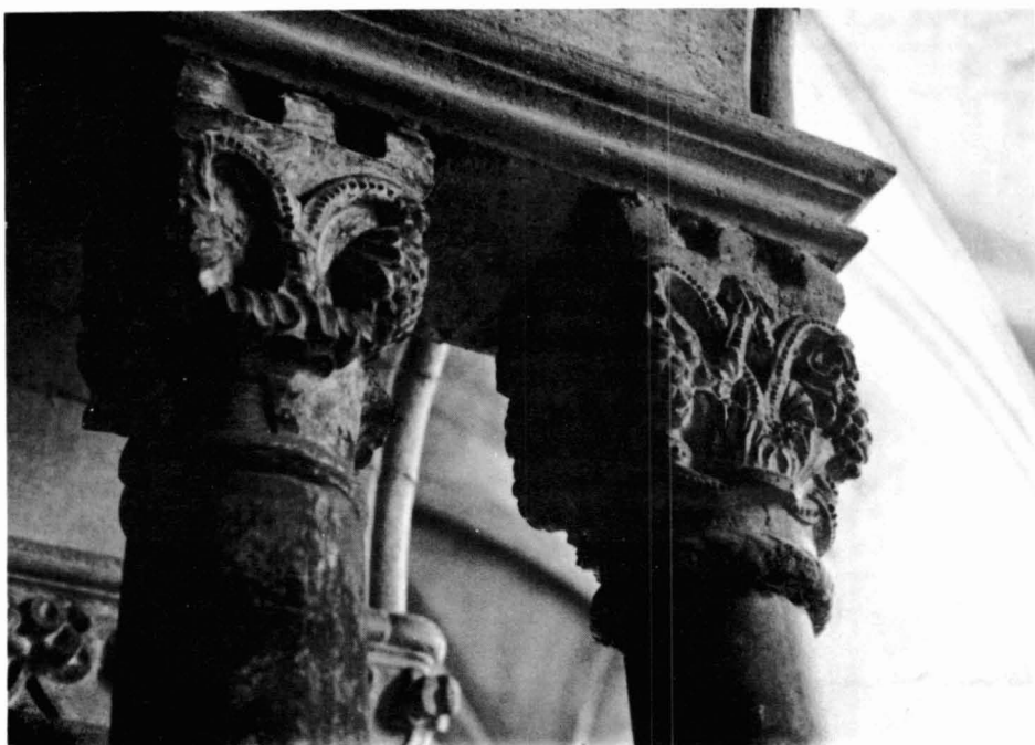
Figura 2. Trifori de Sant Feliu , de Girona, Capitels núms. 13 i 14.