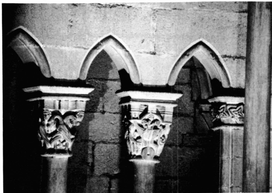
Figura 3. Trifori de Sant Feliu , Girona, Capitells 8 i 9.